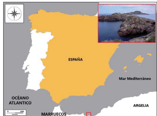
Figura 1: Situación geográfica e imagen de las Islas Chafarinas.

En el aspecto herpetofaunístico, la importancia de las Islas Chafarinas radica en la presencia de diversas especies de reptiles, algunas