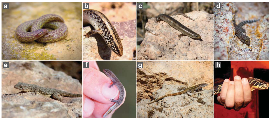
Figura 2: Especies de reptiles presentes en las Islas Chafarinas. (A) T. wiegmanni , (B) C. ocellatus , (C) C. parallelus , (D) H. turcicus , (E) T. mauritanica , (F) S. mauritanicus , (G) P. vaucheri , (H) H. hippocrepis .

presumiblemente restringida a poblaciones puntuales en una estrecha franja costera entre Nador (Marruecos) y Cabo Carbón (Argelia), y la isla de Rey Francisco en las Islas Chafarinas (Fahd et al. , 2002; Civantos, 2000, 2006, 2012). Durante décadas fue confundido en las Islas Chafarinas con C. ocellatus (Mateo, 1990, 1991) o Chalcides bedriagai (Vargas & Antúnez, 1982). Fue descrito por Doumergue (1901), y re-descrito por Caputo & Mellado (1992) como una especie nueva ( C. gharai ). La especie fue finalmente re-nombrada como C. parallelus por Mateo et al. (1995). En las Islas Chafarinas, la especie fue añadida al inventariado herpetofaunístico por Mateo (1997), siendo citada en las tres islas. En nuestros trabajos hemos podido confirmar su presencia únicamente en la isla de Rey Francisco, con una abundancia elevada (Figura 3), a pesar de haber sido buscado en las otras dos islas en numerosas ocasiones. Además, todos los ejemplares colectados en el pasado que se conservan en las colecciones de la Estación Biológica de Doñana y del Museo Nacional de Ciencias Naturales, CSIC, proceden de la isla de Rey. Por lo tanto, es muy pro-