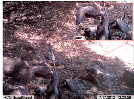
Figura 3. Fotografía obtenida mediante el trampeo fotográfico. En el recuadro rojo se observa la presa, posiblemente se trate de un pollo de mochuelo común ( A. noctua ), y la culebra bastarda ( M. monspessulanus ).