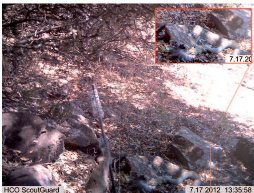
Figura 2. Fotografía donde se observa en la zona inferior el macho de culebra bastarda ( M. monspessulanus ) engullendo a la presa (recuadro rojo).

En total se obtuvieron 7.546 contactos de animales (foto - capturas) y en sólo 28 de ellas se fotografió algún reptil. El porcentaje de foto - capturas de reptiles fue extremadamente bajo (0,4%), a pesar de que los muestreos se realiza-