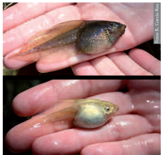
Figura 1. Comparación de un ejemplar típico (arriba) de P. cultripipes y el xántico (abajo) encontrado en la Finca Los Quiñones de Levante (Almadén, Ciudad Real).

traban numerosos ejemplares de su misma especie (se contabilizaron 137 larvas) con su coloración típica marrón oscura, por lo que el ejemplar atípico resaltaba sobre el resto, así como Pelophylax perezi adultos.