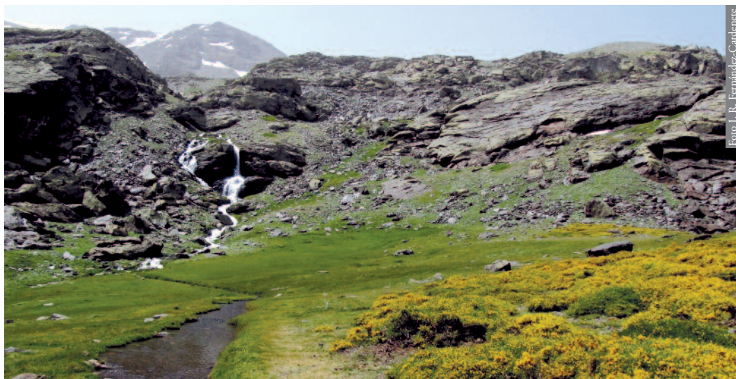
Figura 2. Hábitat típico de la culebra lisa europea ( C. austriaca ) en Sierra Nevada. Lavaderos de la Reina, Güéjar-Sierra.

(Anexo 1, Figura 1), tanto en el sector occidental como en el oriental, ampliándose su distribución hasta 26,95 km 2 .