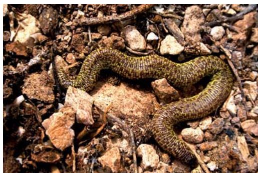
Figura 1. Adulto de culebrilla mora ( T. wiegmanni ).

Los anfisbenios son reptiles adaptados a la vida fosorial (cuerpo alargado, generalmente sin extremidades y visión reducida) cuya ecología es muy poco conocida debido a sus hábitos subterráneos. La culebrilla mora ( Trogonophis wiegmanni Kaup, 1830) es un anfisbenio de la Familia Trogonophidae caracterizado por poseer pequeñas escamas cuadrangulares, amarillas, violáceas, pardas o negras, con un característico diseño ajedrezado (Figura 1). El vientre es de color uniforme, amarillo o malva según la subespecie, y la cabeza negra. Sólo unos pocos estudios han abordado su biología y ecología (Bons & Saint-Girons, 1963; López et al. , 2002; Civantos et al. , 2003).