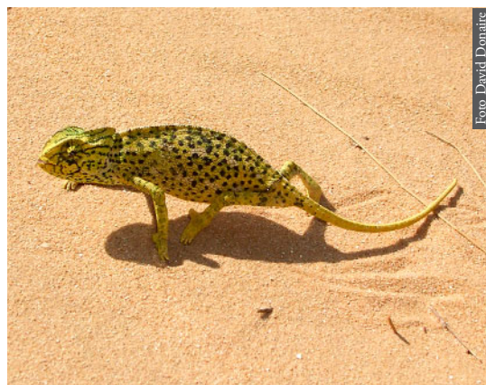
Figura 5. Chamaeleo chamaeleon de Barbate, Cadiz, España.

compañía, o por su carácter de especies comensales. Su presencia en ambas orillas del estrecho probablemente se deba a introducción activa o pasiva por parte del hombre, y date de épocas históricas o a lo sumo prehistóricas. En islas del Mediterráneo Occidental este es el origen conocido para numerosas especies de vertebrados (Vigne & Alcover, 1985; Mayol, 1997). Sería el caso de Testudo graeca (Alvarez et al. , 2000), Chamaeleo chamaeleon (Hofman et al. , 1991; Paulo et al. , 2002), algunos linajes de Tarentola mauritanica (Harris et al. , 2004a, c) y Hemidactylus turcicus (Carranza & Arnold, 2006). Testudo graeca ha sido mantenida en semi-