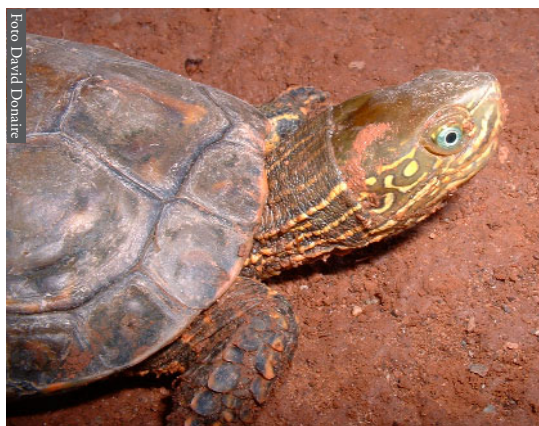
Figura 4. Mauremys leprosa saharica de Ued Masa, Marruecos.

cautividad por diversas culturas Mediterráneas (Fahd & Pleguezuelos, 1996), por lo que no es de extrañar su introducción de forma voluntaria por parte del hombre, como sigue ocurriendo actualmente a través del Estrecho de Gibraltar (Mateo et al. , 2003). Chamaeleo chamaeleon (Figura 5) ha tenido un sentido mágico para el hombre a lo largo de la historia (Blasco et al. , 2001), que continuamente lo ha desplazado a lo ancho del Mediterráneo; incluso, los marcadores moleculares han permitido detectar que las poblaciones ibéricas han tenido un origen doble en época reciente (Paulo et al. , 2002). Los hábitos rupícolas de las salamanguetas presentes en el área de estudio favorece el que frecuenten las habitaciones humanas, y es bien conocido la amplia disper-