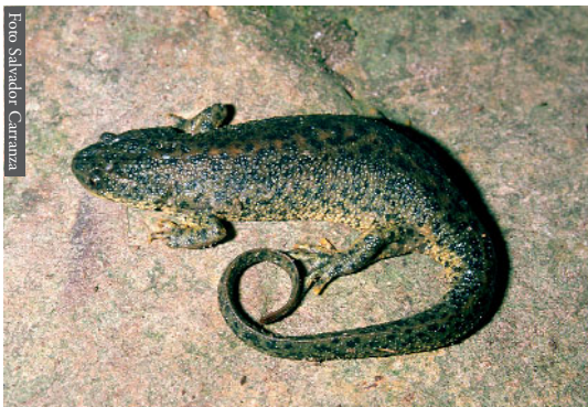
Figura 7. Pleurodeles nebulosus de Ain Draham, Túnez.

e) Por último, en un contexto temporal más próximo, Le Houerou (1992) ha reconstruido el progreso de los límites del desierto del Sahara desde hace 18 000 años, estudiando la vegetación y las dunas fósiles; ha concluido que el límite septentrional del desierto se ha movido hacia el norte durante este periodo, alcanzando la costa del Mediterráneo en el Marruecos Oriental. Ello explica el importante contingente de reptiles saharianos que alcanzan el Mediterráneo en el Rif Oriental ( Uromastix acanthinurus , Acanthodactylus boskianus , A. maculatus , Stenodactylus sthenodactylus , Spalerosophis dolichospilus ; Fahd & Pleguezuelos, 2001), algunos de ellos aproximándose o alcanzando el Estrecho de Gibraltar a través de las áridas costas del Mediterráneo, como Psammophis schockari (Mateo et al. , 2003). En cualquier caso, la distribución de los reptiles a lo largo de la franja del Rif da lugar a un proceso de reemplazamiento de fauna Mediterránea y Paleártica de Oeste a Este, por fauna sahariana de Este a Oeste (Figura 1 en Fahd & Pleguezuelos, 2001). Sin embargo, las especies afectadas por este reemplazamiento apenas se agrupan en corotipos, probablemente como consecuencia que el proceso de colonización de fauna sahariana hacia la costa del Mediterráneo a través del valle del Ued Muluya está aún en un proceso actual y dinámico (Real et al. , 1997).