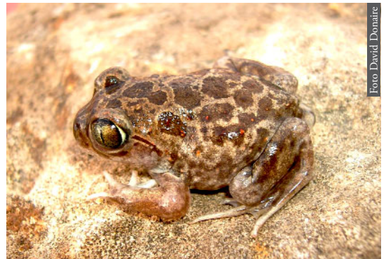
Figura 3. Pelobates varaldii de Kenitra, Marruecos.

En relación a la formación del Estrecho de Gibraltar como proceso vicariante, hay algunas especies que han mostrado un dimorfismo morfológico y, sobre todo, una distancia genética, que está en concordancia con el tiempo transcurrido, aproximadamente 5.33 Ma. En anfibios seis de los siete grupos hasta ahora estudiados siguen este patrón vicariante ( Salamandra , Pleurodeles , Alytes , Discoglossus , Pelobates y Pelophylax ); mientras que en reptiles la apertura del Estrecho de Gibraltar parece haber afectado tan solo a seis de los 15 grupos estudiados hasta el momento ( Acanthodactylus , Blanus , Natrix maura , Chalcides , Tarentola y Vipera ). Si el proceso de vicarianza ocurrió para