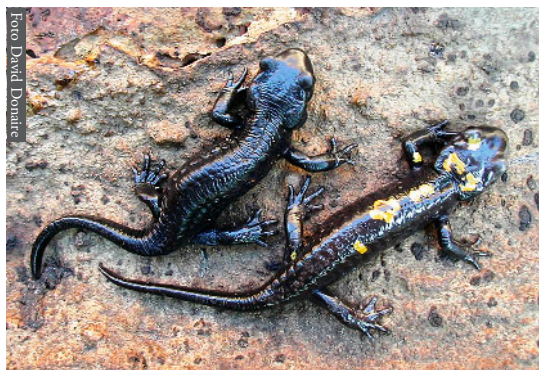
Figura 6. Salamandra algira tingitana de Tagramt, Marruecos.

La composición de la fauna en la orilla sur del estrecho es el resultado de una historia más complicada de la que dibuja la simple dispersión hacia el noroeste de África de formas etiópicas, o la formación del Estrecho de Gibraltar. Algunos de los factores que se supone han intervenido en la conformación de esa fauna, se citan a continuación: