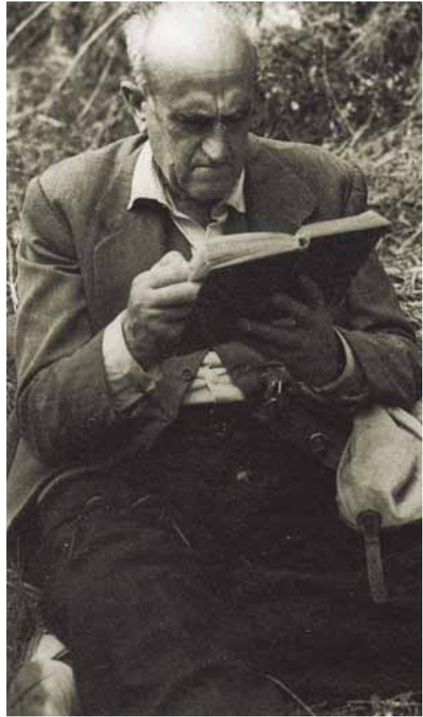
Institut Botànic de Barcelona

D'una banda, el mateix coneixement que és el fonament de la recerca etnobotànica té una base científica. Les