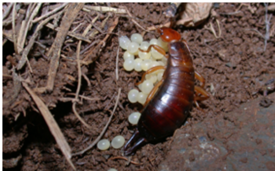
Hembra de Chelidura pyrenaica cuidando de la puesta (Andorra)

“El Museo investiga muestra algunos de los resultados así como el desarrollo de investigaciones llevadas a cabo por científicos del MNCN”