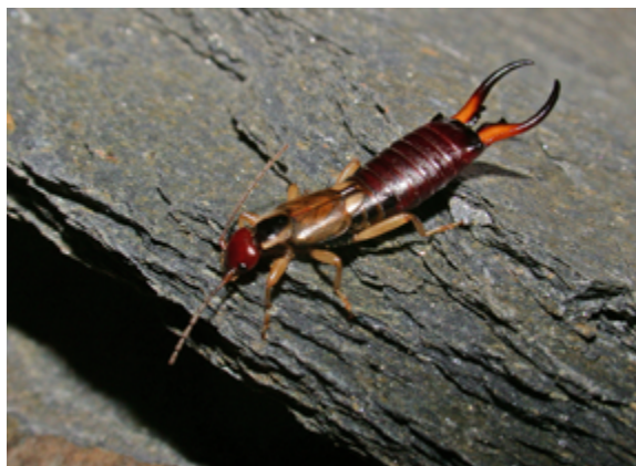
Forficula auricularia , ejemplar macho de Colmenar Viejo (Madrid)

“Presentes en jardines y huertos, las tijeretas son insectos discretos que se alimentan, entre otros, de pulgones y cochinillas, por lo que son importantes aliados para la agricultura”