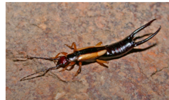
Doru taeniatum , Jalisco (México)