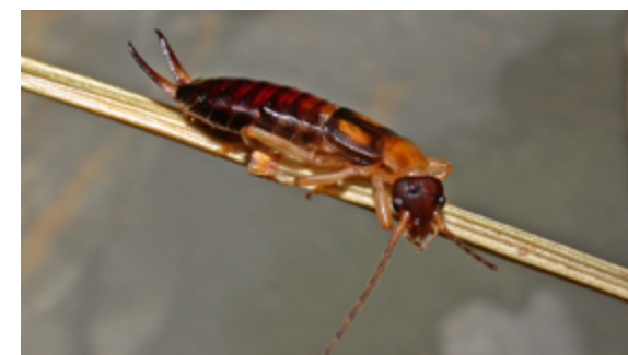
Forficula ruficollis ejemplar hembra de un jardín de Asturias