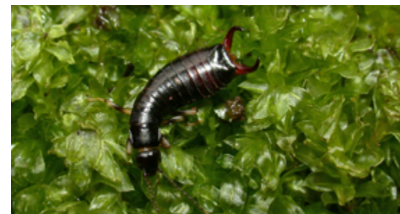
Euborellia sin identificar de las montañas de Veracruz (México)