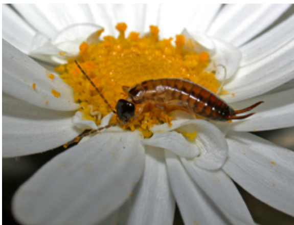
Guanchia pubescens , ninfa de Baena, Córdoba

tremo del abdomen endurecidos y en forma de pinzas o de tijeras. Son insectos discretos, que generalmente pasan desapercibidos a pesar de su ubicuidad, que a menudo habitan en los jardines y en los huertos. Las tijeretas son fundamentalmente depredadoras y se alimentan de otros insectos, especialmente de pulgones y cochinillas, por lo que son importantes aliados para la agricultura. Cuando escasean sus presas se alimentan de materias vegetales, como polen, pétalos de flores o frutos en descomposición. Su comportamiento es extraordinario en muchos aspectos, algunas es-