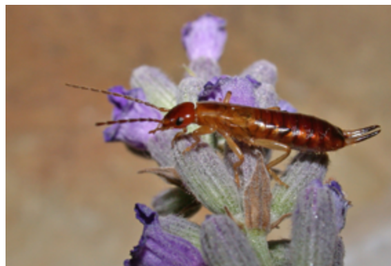
Forficula lesnei , ejemplar hembra de Parres (Asturias)