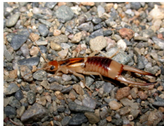
Labidura riparia , macho en una playa (Ceuta)

pecias usan las pinzas para capturar a sus presas, los machos de otras realizan “bailes” de cortejo mostrando las pinzas a la hembra, y las hembras cuidan de los huevos y de las ninfas recién nacidas. La diversidad de formas y colores es enorme, y las pinzas pueden adoptar formas complicadísimas. Sin embargo es un grupo muy poco estudiado y ahora estamos empezando a descubrir su diversidad real. A lo largo de la exposición se presentan de manera gráfica algunos de los objetivos y resultados del proyecto, y se proporciona una visión general sobre la biología, la distribución geográfica y la enorme diversidad del grupo.