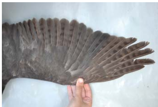
Figura 9. Macho de 4+ ac capturado el 25 de junio de 2008 con dos pollos de 25 días en nido. Se observa que ya ha mudado la P1 y la P2, el resto de las plumas son de patrón adulto, mudadas el año anterior (2007) y tiene retenida la S8 de una generación anterior (2006).