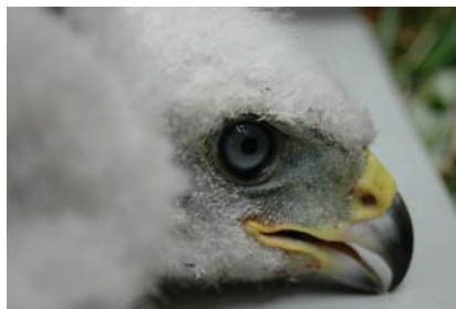
Figura 11. Iris de un pollo hembra de 23 días de edad.