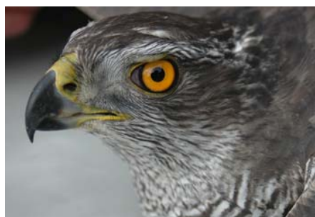
Figura 14. Detalle de la cabeza e iris todavía amarillo de una hembra de 4+ ac (CRES de Martioda, Alava, 24 de febrero de 2008).