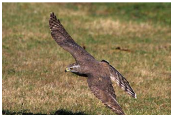
Figura 1. Accipiter gentilis gentilis , hembra de segundo año de origen finlandés.

Los azores europeos incrementan un 4% su tamaño por cada 10° de latitud hacia el norte, de tal forma que los azores finlandeses son un 10% mayores que los de la islas mediterráneas (Kenward, 2006). Las diferencias de tamaño y color siguen un gradiente relacionado con la Regla de Bergman, siendo de volúmenes mayores y más claros en el norte y reduciéndose y oscureciéndose a medida que se avanza hacia el Mediterráneo. Como en otras especies de distribución geográfica parecida, las diferencias entre poblaciones no son sino un reflejo de la variación clinal de la especie, que da lugar a fenotipos muy diferenciados en los extremos del rango de distribución y fenotipos intermedios en las zonas de transición (Zuberogoitia et al., 2009a). Estas variaciones geográficas graduales han motivado la diferenciación de la especie en numerosas formas raciales (Kenward, 2006).