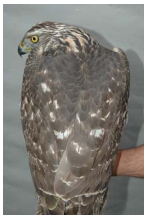
Figura 3. Vista dorsal del ejemplar hembra joven capturada en Álava, norte de España, en enero de 2008. El patrón dorsal claro, con abundantes manchas blancas y nuca blanquecina sugieren que se trata de un ejemplar nórdico invernante.