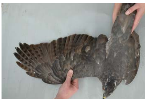
Figura 10. Hembra de 4+ ac (CRES de Martioda, Álava, 24 de febrero de 2008) en donde se observan dos generaciones de plumas de adulto. Este ejemplar dejó sin mudar un gran número de rémiges: la P9 y la P10 así como las S5, 6, 9, 10 y 12. También se aprecian las dos generaciones de plumas en el manto.