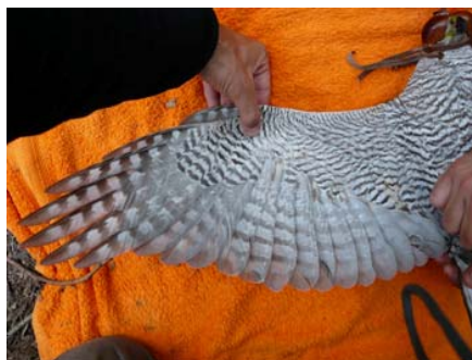
Figura 12. Ejemplar macho adulto anillado en el nido en 2009 y recapturado como reproductor el 21 de junio de 2011 (edad 3ac). Presenta todo el plumaje de adulto, salvo media docena de infracoberteras que están retenidas y de patrón juvenil.