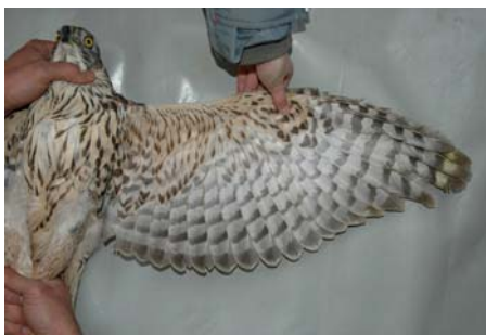
Figura 2. Ejemplar hembra joven capturada en Álava, norte de España, en enero de 2008. El patrón de coloración del vientre, así como la cabeza y el dorso (Fig. 3) y su peso de 1.300 gr, sugieren que se trata de un ejemplar nórdico invernante.