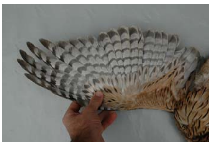
Figura 4. Patrón juvenil de un macho de azor ibérico. El fondo del vientre es pardo-rojizo, con barras verticales. Las rémiges son, en general, más estrechas y puntiagudas que las adultas. Se observa un plumaje uniforme.