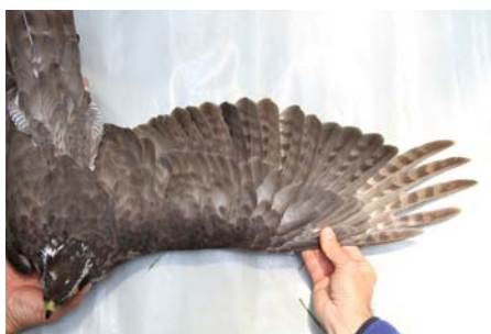
Figura 7. Hembra capturada el 11 de junio de 2011 en Bizkaia con dos pollos de 27 días de edad. Las cuatro primeras primarias están nuevas, la P5 tirada y el resto de una generación anterior. Además, ya ha comenzado la muda de las secundarias, que va con retraso con respecto a las primarias. Así se ve cambiada la S5 y, aunque no se ve, la S6 estaba creciendo. El resto de secundarias son de la generación anterior, con desgaste diferencial en el que se observa cuáles fueron las últimas plumas mudadas la temporada anterior, las más nuevas de la generación anterior (S1, 2, 4 y 8) pero que muestran un desgaste mayor y son más pálidas que la primera pluma mudada el año en curso (P1). Con estos datos sería un 3+ ac (ver Tabla 1).