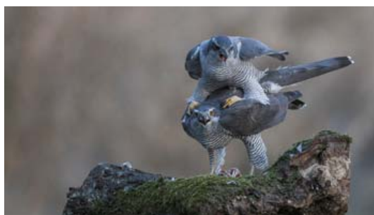
Figura 15. Cópula.

Las cópulas (Figura 15) comienzan uno o dos meses antes de la puesta, con picos máximos de frecuencia de cópulas entre los 30 y los 5 días antes de la puesta, cuando llegan a una media de 10 cópulas por día, y reduciéndose notablemente con la puesta del primer huevo (Kenward, 2006).