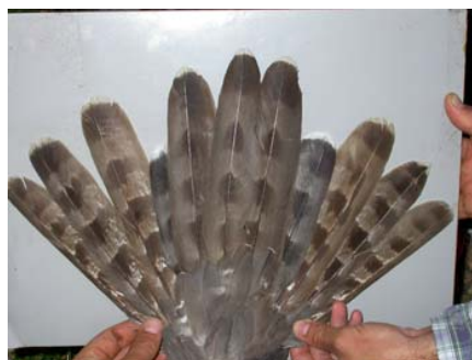
Figura 8. Cola de hembra adulta (3+ ac) capturada en Bizkaia el 22 de mayo de 2004 con tres pollos de 20 días. Se observa cómo están creciendo las dos RR3, mientras que el resto de plumas son de la generación anterior, con desgaste diferencial debido al tiempo que pasó desde que mudó la primera (R4) hasta la última (R1 o R5).