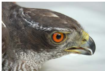
Figura 13. Detalle de la cabeza e iris de un macho de 4+ ac (Bizkaia, 24 de junio de 2008), aún de tonos naranjas.