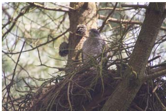
Figura 16. Macho posado en el nido mientras la hembra incuba. ( ) I. Zuberogoitia

Las hembras ponen los huevos con un intervalo de 1,9 días (Mañosa, 1991). La incubación suele comenzar con la puesta del segundo o tercer huevo, según individuos. La incubación es realizada por la hembra, relevada por el macho sólo cuando ésta deja el nido para alimentarse o darse un baño (Kenward, 2006). Los machos suelen pasar bastante tiempo posados en el nido mientras la hembra incuba al lado (Figura 16; obs. pers.). Transcurrido un periodo de incubación de 36,5 – 41,3 días comienzan a nacer los pollos (Kenward, 2006), que pueden tardar hasta dos días en romper la cáscara y salir completamente del huevo.