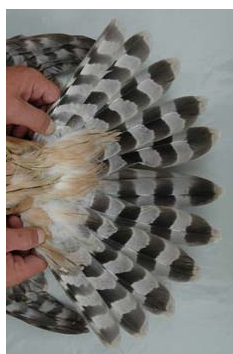
Figura 5. Cola juvenil de azor ibérico macho. Se observa un plumaje uniforme.