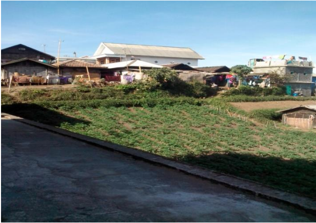
Kebun kentang di Desa Ngadas

kepada pihak luar atau orang yang berasal dari luar masyarakat adat Tengger Desa Ngadas. Upaya ini sengaja dilakukan agar sumberdaya tanah dan ladang mereka tidak beralih kepemilikannya kepada pihak lain, karena bagi mereka, tanah ladang yang mereka miliki tidak hanya bersifat ekonomis, lebih dari itu memiliki makna dan nilai spiritual, sosial, dan budaya bagi kelangsungan hidup mereka.