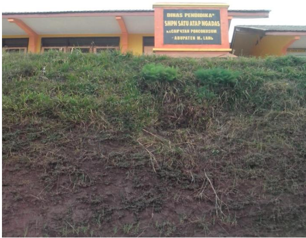
SMP Satu Atap Desa Ngadas

Disamping sistem pengetahuan yang berasal dari dalam masyarakat sendiri, masyarakat Desa Ngadas juga mendapatkan pengetahuan dari pendidikan formal yang ada di desa tersebut mulai dari pendidikan anak usia dini, sekolah dasar dan SMP Satu Atap Desa Ngadas. Selain itu berbagai pelatihan juga telah diadakan di Desa Ngadas dari beberapa dinas terkait, KKM Mahasiswa UGM, Pusat Bahasa UM dan beberapa program pemerintah yang pernah masuk di Desa tersebut seperti WSLIGG, PNPM Pedesaan dan sebagainya. Adanya program-program tersebut menambah pengetahuan masyarakat Desa Ngadas tentang pengelolaan air minum, pengolahan makanan dan jenis jajanan dari kentang, pengetahuan tentang bahasa, pengelolaan desa wisata, pengelolaan sistem pemerintahan dan sebagainya.