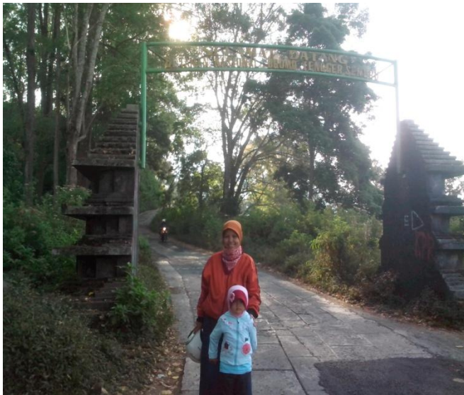
Jalan memasuki TNBTS

Keramahtamahan penduduk Desa Ngadas sangat kami rasakan ketika kami mulai berjalan-jalan mengelilingi Desa Ngadas. Di sepanjang jalan kami menemui beberapa penduduk, baik yang sedang melakukan kerja gotong royong membangun rumah, maupun ibu-ibu yang sedang mengasuh anak-anaknya dan beberapa penduduk yang sedang bekerja di ladang-ladang. Mereka menyapa kami dengan ramah, menanyakan asal kami, mengajak kami untuk mampir ke rumahnya dan memberi informasi tentang apa saja yang kami tanyakan. Pada siang hari Desa Ngadas relatif sepi, karena sebagian besar dari masyarakatnya berada di ladang-ladang dan sawah mereka untuk bekerja. Beberapa orang yang bisa ditemui adalah mereka yang bekerja membangun rumah dan para perempuan yang sedang mengasuh anak-anaknya. Sedangkan anak-anak usia sekolah bisa ditemui di sekolah-sekolah formal dari Sekolah Dasar sampai Sekolah Menengah Pertama Satu Atap yang sudah ada di Desa Ngadas.