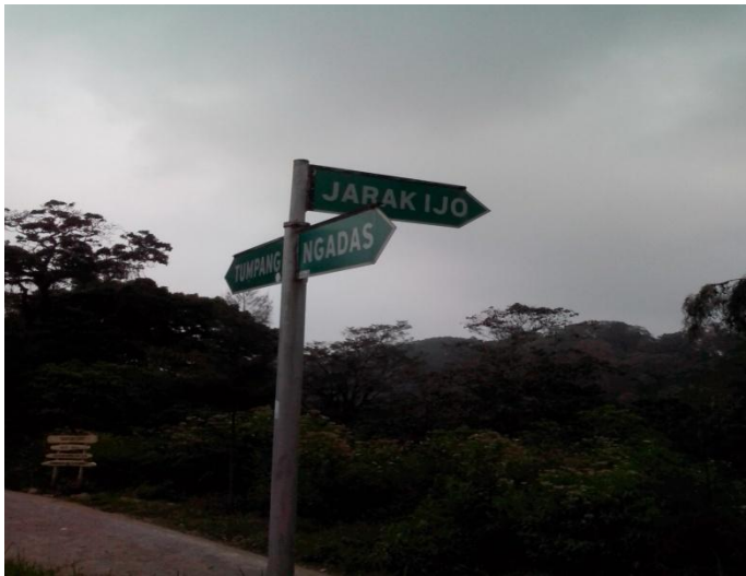
Penunjuk arah ke Dusun Ngadas