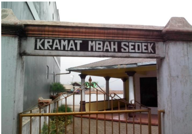
Makam Kramat Mbak Sedek

Sebuah etnografi ada baiknya juga dilengkapi dengan keterangan mengenai asal-mula dan sejarah suku bangsa yang menjadi pokok deskripsinya. Dalam usaha ini seorang ahli antropologi perlu bantuan dari para ahli sejarah atau ahli-ahli ilmu bantu pada ilmu sejarah lainnya. Keterangan mengenai asal mula suku bangsa yang bersangkutan biasanya harus dicari dengan mempergunakan tulisan para ahli prehistori yang pernah melakukan penggalian dan analisa benda-benda kebudayaan prehistori yang mereka temukan di daerah sekitar lokasi penelitian.