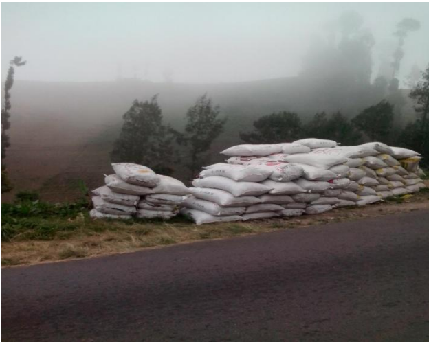
Pupuk yang akan didistribusikan ke ladang