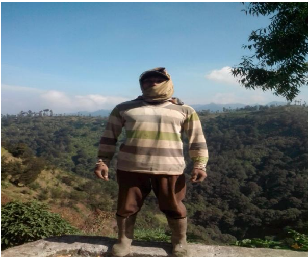
Kain sarung yang diikatkan di kepala

Sedangkan untuk perempuan, mereka biasanya memakai kain robogan/sewek yang ditalikan/dipakai sebetan dan diselempangkan di lehernya, biasanya kain diselempangkan ke samping, tetapi apabila mereka bekerja kain diselempangkan ke belakang, agar tidak mengganggu dalam melakukan pekerjaan. Terkadang kain juga dipakai sebagai ikat perut/ sembung , ketika mereka sedang bekerja di ladang-ladang pertanian.