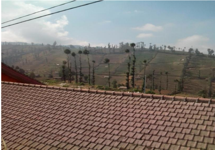
Pola tanam larian di Desa Ngadas

Jawa maupun di luar Pulau Jawa yang umumnya menggunakan pola tanam “ sengkedan ” atau terasering.