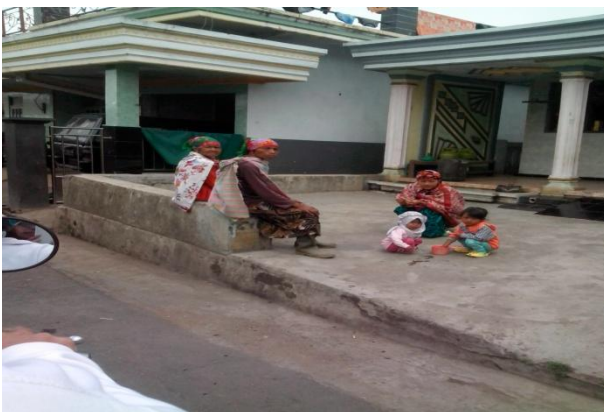
Baju adat perempuan dengan kain di belakang