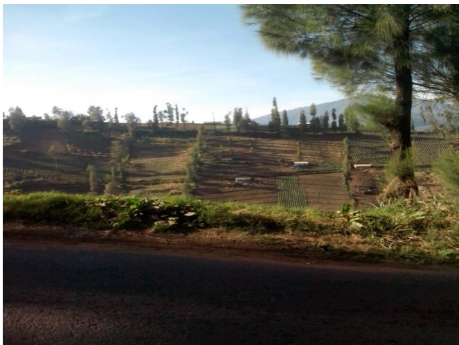
Topografi Desa Ngadas