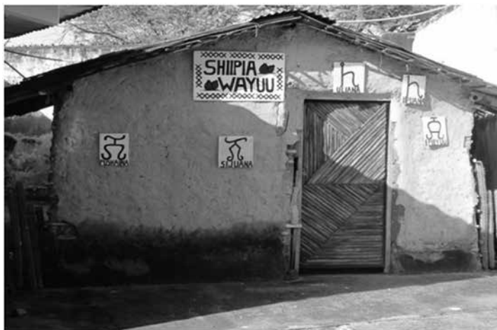
Imagen 4.2 Ranchería. Elaborada por estudiantes de la Normal en el patio de la institución (noviembre 2010).