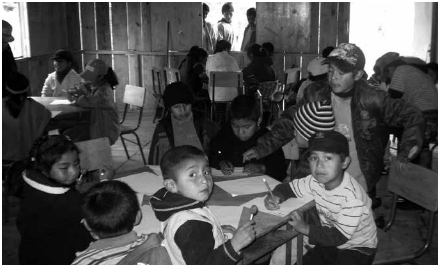
Imagen 2.3 Niños dibujando su escuela. Vereda Agoyán (Equipo de Investigación Equidad y Diversidad en Educación, 2010).

Según nos comenta uno de los profesores, la educación propia en este territorio se encuentra fundamentada a partir de algunos cuestionamientos: