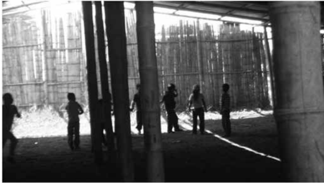
Imagen 3.3 Dentro de las aulas (foto tomada durante la visita a la experiencia. Nov. 2010, Grupo Equidad y Diversidad).

Es decir, reconocen que no es fácil mantener estas tradiciones en medio no solo de las condiciones climáticas, sino del bombardeo permanente que hacen otras propuestas culturales, a través de los medios masivos de comunicación; así, el indígena de este siglo, a pesar de sus intenciones se ve influenciado por otras propuestas que vienen de fuera y que no solamente generan el que no utilice la lengua propia, el que no se vista con los atuendos tradicionales, sino el que se reproduzcan muchos de los pilares de la enseñanza occidental. Los niños, por ejemplo, repiten melodías de canciones externas a su cultura para aprender las vocales y sus combinaciones, hacen planas para mejorar la letra y realizan un sin número de tareas que poco les significan en su contexto y que casi nada tienen que ver con su realidad y que en nada se diferencian de las que realizan otros niños de la escuela regular en otras experiencias, con otras necesidades y con otras búsquedas.