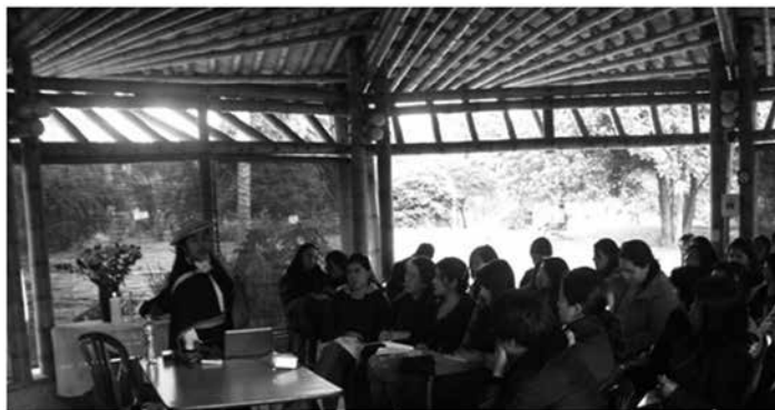
imagen 5.4 Sesión de trabajo. Palabra de origen. Diplomado en Educación Inicial y Diversidad Cultural (2011).

Esta referencia es, desde nuestra perspectiva, un llamado para revisar la noción de identidad que manejamos, pues partimos de una idea esencializada de lo indígena en donde su identidad debe permanecer estática y en la cual los reacomodamientos, desplazamientos, inconsistencias, son leídas por los mestizos occidentales como inadmisibles, pues aún inscritos en la imagen del buen salvaje, esperamos de ellos sino una absoluta ingenuidad, una intolerable malicia y en general una incapacidad para ser, pues cualquier gesto es leído como remedo de lo occidental y pérdida de su inmutable identidad. La identidad exigirá comprender que todos nosotros estamos siempre en un ejercicio de constitución de nuestro ser y que la tarea es permitirnos mutuamente la permeabilidad.