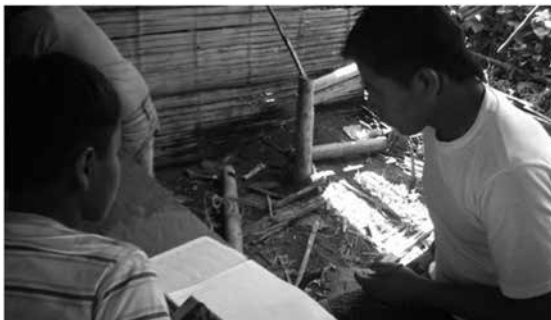
Imagen 3.2 Actividades pedagógicas (foto tomada durante la visita a la experiencia. Noviembre 2010, Grupo Equidad y Diversidad).

Dadas las condiciones de mezclas culturales, fruto de los procesos de globalización de esta época, el manejo de la lengua materna no es generalizado en todos los maestros, hay una heterogeneidad frente al uso lingüístico y eso dificulta el desarrollo de las intencionalidades propuestas; no solo porque se dificulta el afianzamiento de procesos culturales –“somos profesores que no hablamos bien ni el guambiano ni el español, entonces tenemos que aprender y enseñar a los niños”–; sino porque el no tener unos claros desarrollos comunicativos determina el no reconocimiento de su propuesta por parte de autoridades gubernamentales y nacionales, ese temor se explicita cuando afirman: “entonces el Estado dijo: ‘tal comunidad no habla el dialecto, ni cultura ya no es comunidad indígena, ya civilizaron’”, es decir, tienen completamente claro que el conocimiento y uso apropiado de la lengua es un requisito fundamental para su reconocimiento como comunidad indígena.