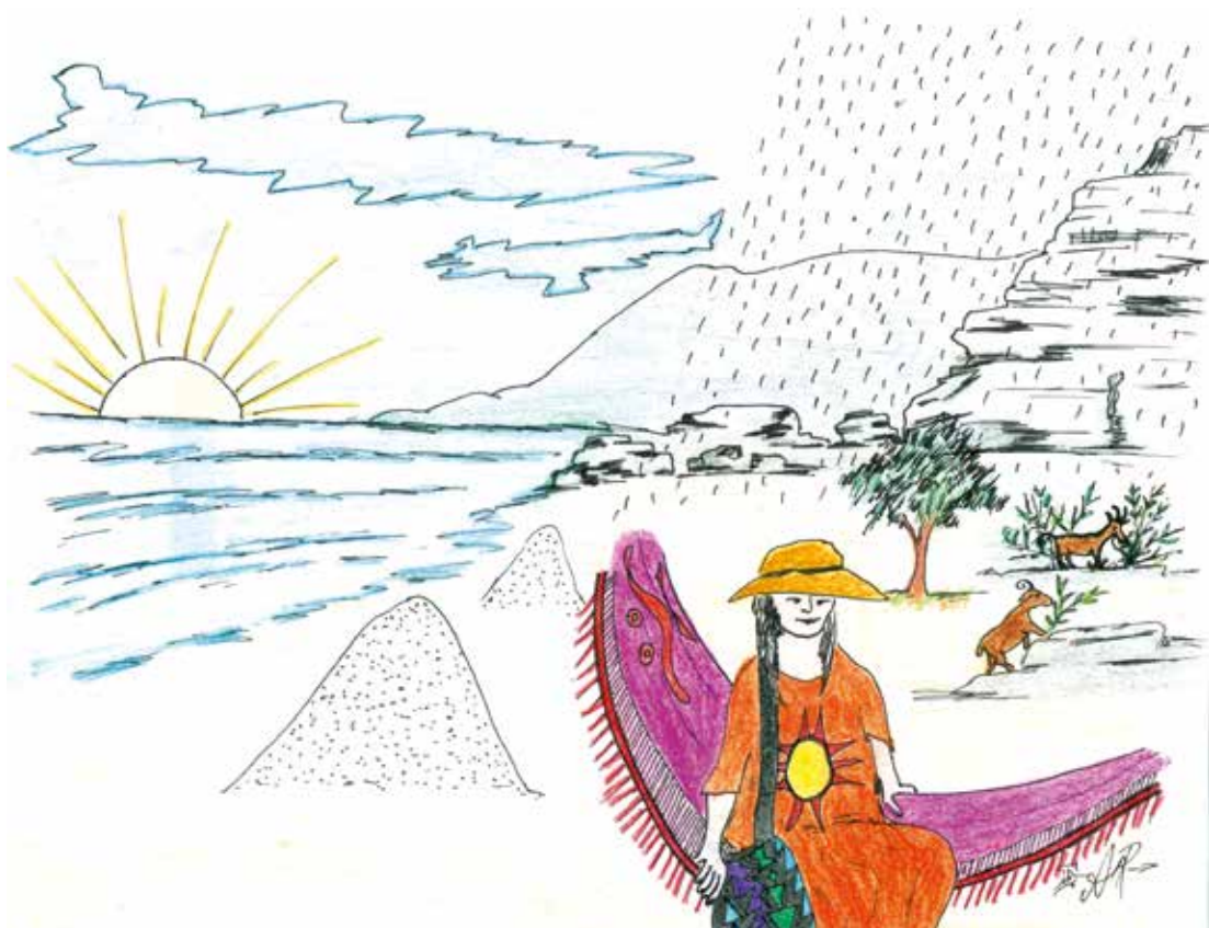
Aníbal Rivera /miembro del Pueblo Indígena de Ámbalo