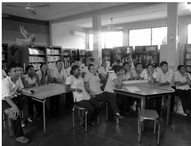
Imagen 4.6 Sesión de exposición de los estudiantes ciclo complementario (noviembre 2010).