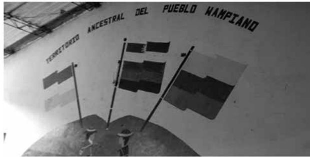
Imagen 3.1 Mural de la Escuela. San Antonio Morales (foto tomada Visita a la Experiencia. Nov. 2010, Grupo Equidad y Diversidad)