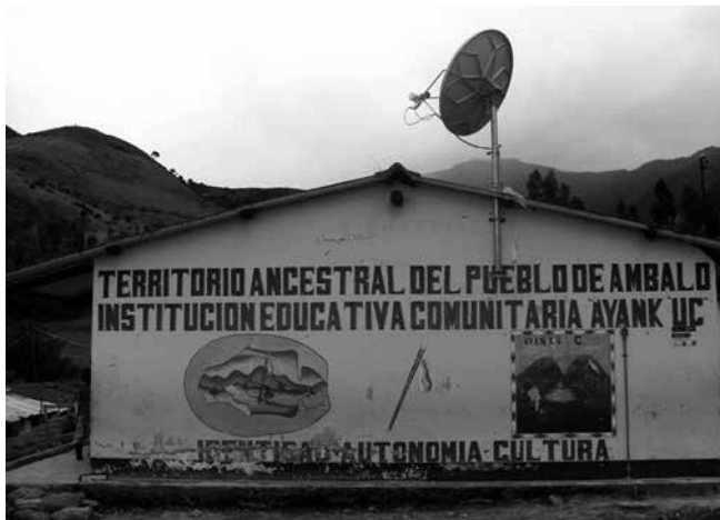
Imagen 2.2 Escuela Ayankú'c, vereda Agoyán (Benavides, 2010).

Cuando empezamos a caminar en esta experiencia encontramos que el aroma a nuestro alrededor empieza a cambiar y vemos el fogón en la cocina de la escuela. Allí se encuentran algunas madres de familia que nos reciben de la mejor manera, nos estrechan