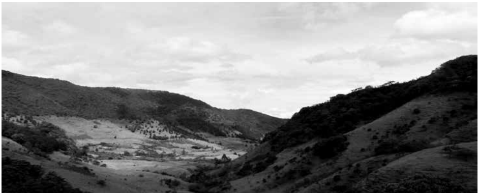
Imagen 2.1 Resguardo indígena de Ambaló, vereda Letras (Benavides, 2011).

Desde lo que se logra comprender, esto es un evento que enuncia rasgos de la identidad de este pueblo y de las tradiciones. Se dice que: