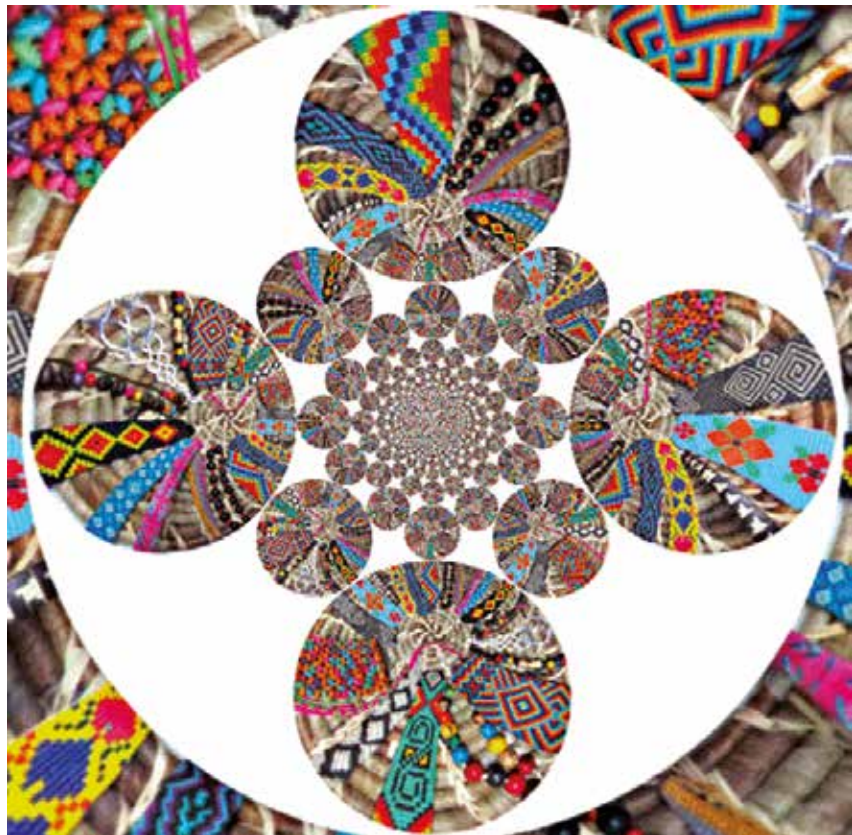
Diseño elaborado por / Angie Benavides y Anibal Rivera. Representación del pensamiento indígena. 2013.