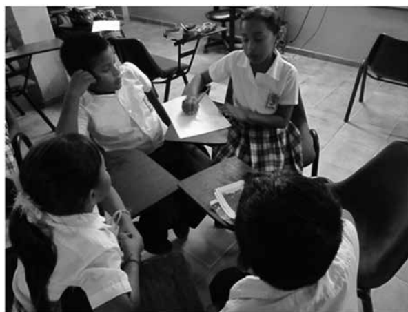
Imagen 4.4 Sesión de trabajo con estudiantes (noviembre 2010).

Una característica primordial y obligatoria es la incorporación de la lengua wayúu en todo el proceso educativo. El abordaje de la cultura y la lengua, el wayunaiki, se da tanto en los espacios académicos como en la vida misma de la Escuela Normal. Se entiende que la lengua está ligada a la vivencia y la comprensión de la cultura indígena. Una de sus docentes nos dice: