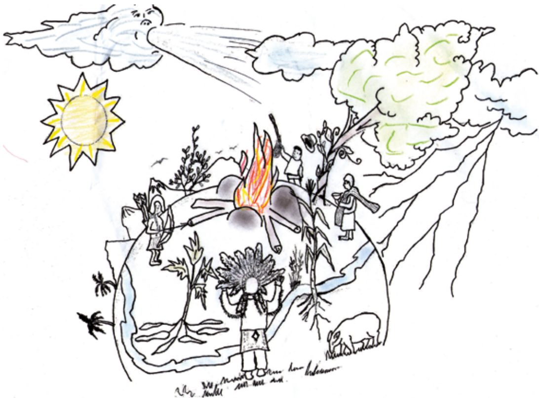
Aníbal Rivera /miembro del Pueblo Indígena de Ámbalo