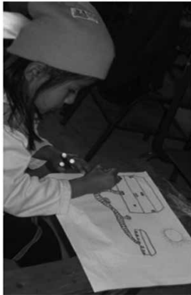
Imagen 3.4 Haciendo las tareas (foto tomada durante la visita a la experiencia. Noviembre 2010, Grupo Equidad y Diversidad).

Todavía son muchas las iniciativas que hay que fortalecer en este campo, porque como se ha venido repitiendo la experiencia es nueva, y aún es muy apresurado hacer análisis exhaustivos de lo que allí sucede específicamente en términos pedagógicos: “ahorita no hemos hecho el plan de estudios, el otro año miraremos el plan de estudios de cada grado, en eso venimos trabajando y pues como yo soy nuevo...”, son palabras de uno de los maestros que evidencian todos los desarrollos que faltan por alcanzar.