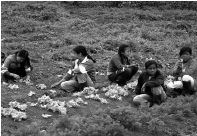
Imagen 2.4 Niños Escuela Agoyán en la huerta escolar (Benavides, 2010).

Como se mencionó, los proyectos pedagógicos y productivos, y la participación de la comunidad son parte de la metodología de enseñanza de esta experiencia, pero