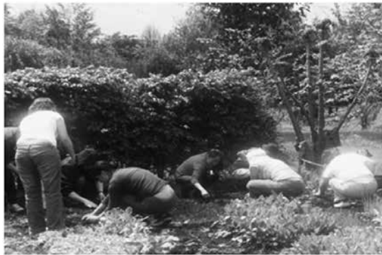
Imagen 5.3 Sesión de trabajo. Madre Naturaleza. Diplomado en Educación Inicial y diversidad cultural (2011).

Las estrategias pedagógicas desplegadas, alrededor del fuego que buscan iluminar no solo los espacios, o el pensamiento, sino sobre todo busca calentar el corazón o derretir el hielo que hay allí (Aangaangaq, 2011), incluyeron sesiones de siembra en la tierra, juegos corporales y de recuperación; los mencionados círculos de palabra, la escritura sobre las propias historias, las propias sombras, etc. Todas estas estrategias