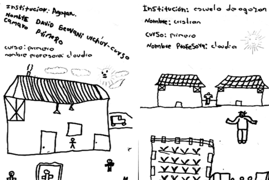
Figura 2.2 Dibujos de los niños acerca de su escuela y su mirada del proceso educativo. En ellos se evidencian los espacios de juego, siembra y la naturaleza y las aulas de clase.