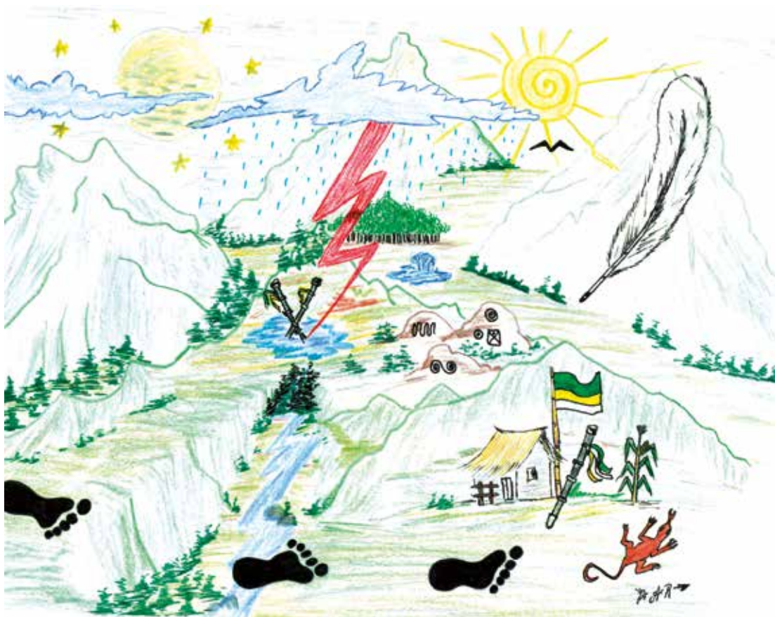
Aníbal Rivera /miembro del Pueblo Indígena de Ámbalo