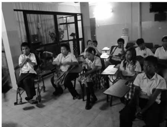
Imagen 4.3 Sesión de trabajo con los estudiantes donde se evidencia la presencia de un estudiante en situación de discapacidad (noviembre 2010).

No está por demás traer a colación la conformación de los grupos. En los salones de clase hay un promedio de 35 a 40 estudiantes diferentes –mujeres, hombres wayúu y alijunas– “casi siempre permanecemos los mismos año tras año”, son muy pocos los que pierden el año, o se van de la escuela. Las causas de deserción casi siempre son las mismas: bajo rendimiento por no estudiar, porque sus padres se los llevan al campo o a otras ciudades. Pocas veces los niños se retiran argumentando que la maestra del grado que cursan no tiene la capacidad para enseñarles. Nos responden de forma segura y precisa estudiantes y docentes.