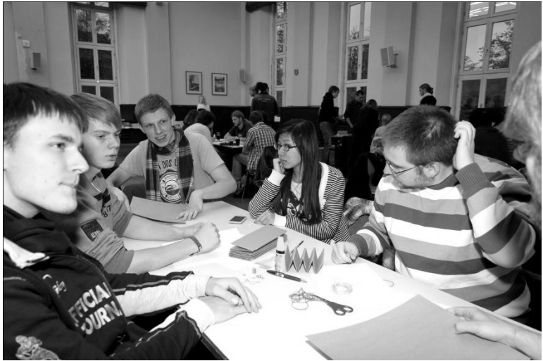
Bild 1 Bei der Lösungsfindung ist Kreativität und Teamwork gefragt.

Testphase gegönnt hatte. Aber es ist auch noch kein Meister vom Himmel gefallen.