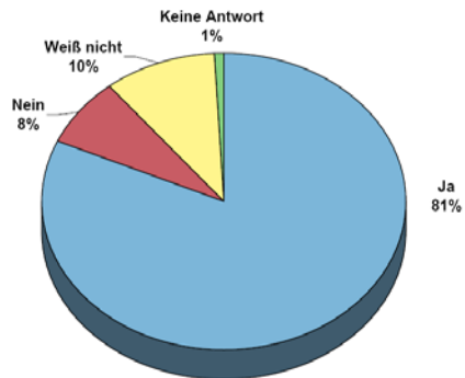
Bild 1: Frage: Würden Ihnen bessere Kurzbeschreibungen (Zusammenfassungen) von Normen helfen, Fehlkäufe zu vermeiden?