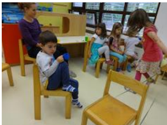
Slika 7.197: Predstava

Po koncu predstave smo se odpravili na šolsko igrišče.