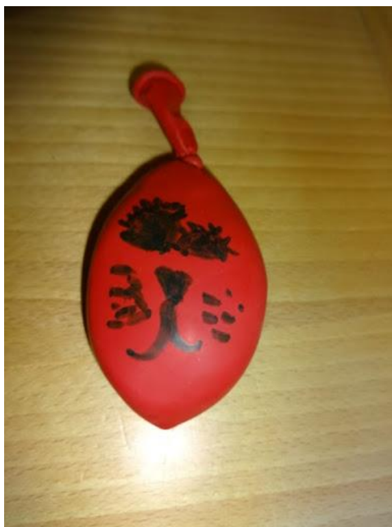
Slika 7.4: Igrača iz balona