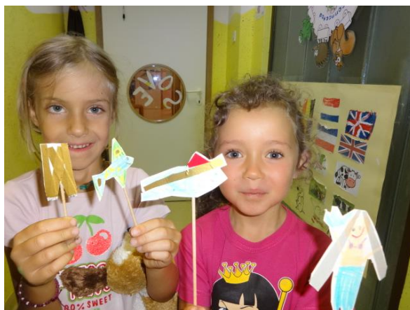
Slika 7.17: Lutke na palčkah