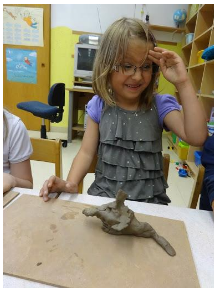
Slika 7.12: Le kaj bo nastalo ...

Otroci so si vzeli čas za oblikovanje. Potrudili so se in nastali so čudoviti izdelki.