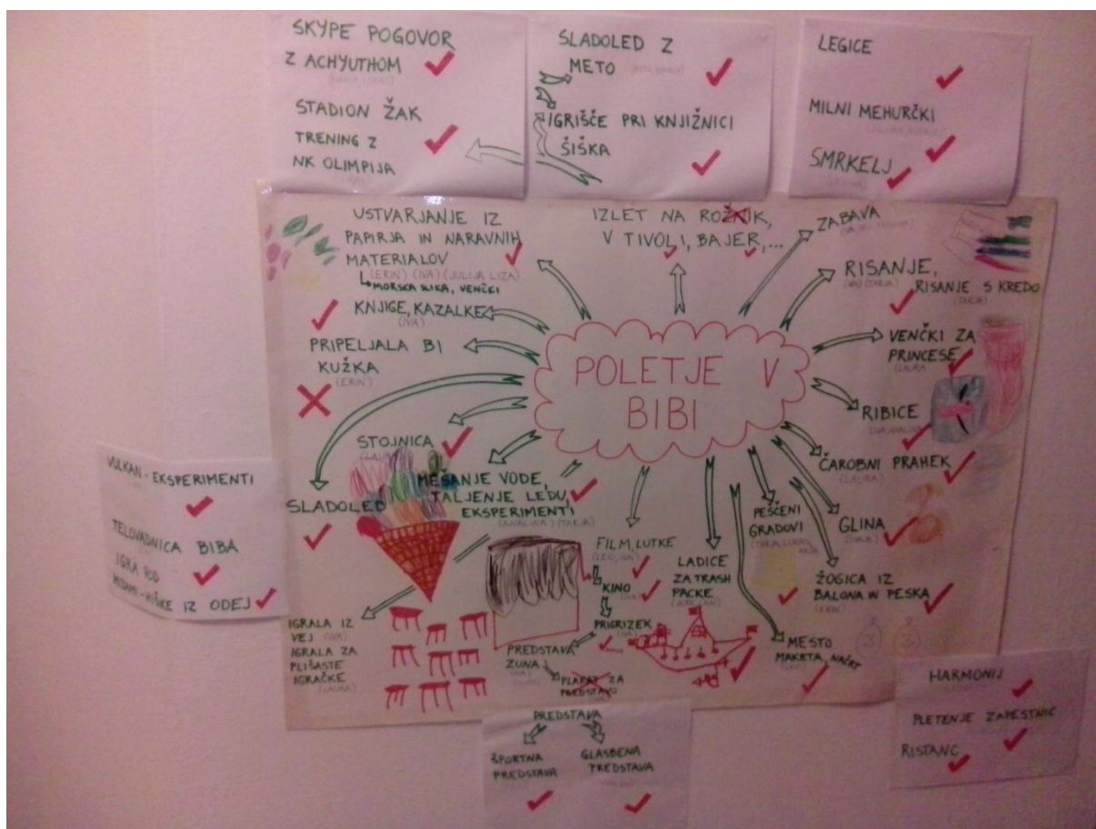
Slika 8.1: Po končanem projektu