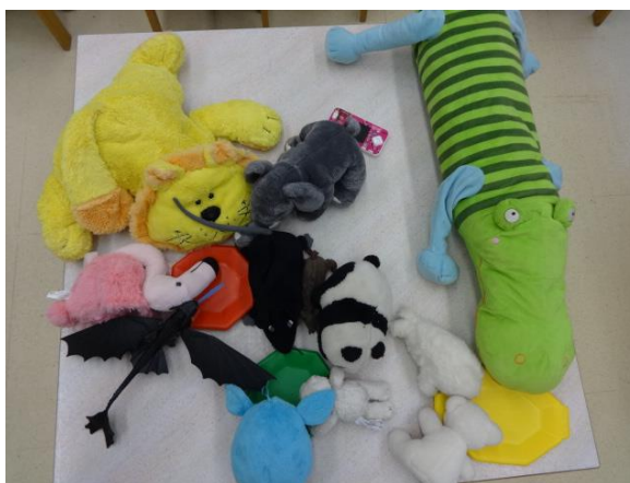
Slika 7.276: Plišaste igrače se zabavajo

Erin: »Še dobro, da vsaj mrvice lahko, pa smetano (rastlinsko), ane, Aleksej.«