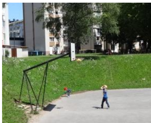
Slika 7.22: Košarka

Danes je Tarjin in Lanov dan. Tarja je oblikovala das maso, Lan pa metal žogo na koš. Oba sta bila zelo uspešna in se uspeha tudi veselila.