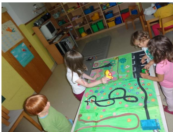
Slika 7.185: Dirkalna steza za avtomobile

Po počitku smo se hoteli igrati. V prostor za Dino park smo postavili plastične dinosavre, na dirkalno stezo avtomobilčke, sezidali pa smo samo dve hiši, in sicer kar iz duplo kock. Potem smo se igrali. Motivacija za barvanje, striženje in lepljenje je padla. Edini način, da zaključimo projekt, je bil ta, da v prostor postavimo igrače.