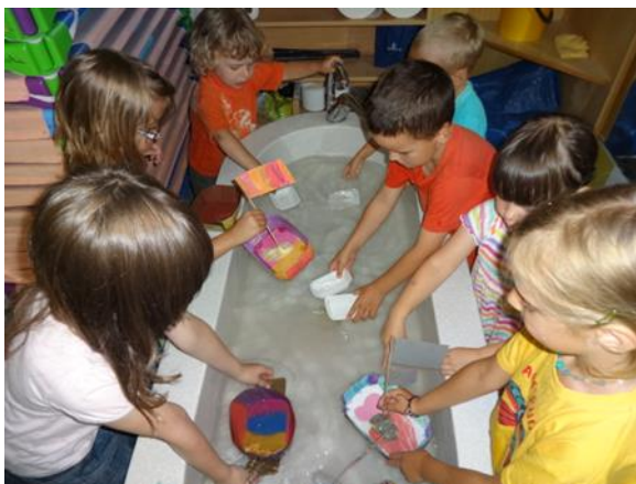
Slika 7.14: Brodolom