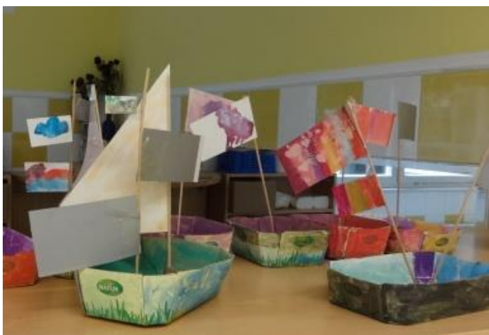
Slika 7.11: Ladjice za Trash packe

Ostali otroci so sicer radi naredili svojo ladjo, ampak jih kasneje ni zanimala. Hoteli so jo vzeti domov, do odhoda domov pa je ladja stala na polici. Jure in Lan pa sta komaj dočakala, da se je posušila. Na ladjo sta naložila igračke ( Trash packe ) in jih prevažala po celi igralnici. Igrala sta se, da je ladja enkrat nad gladino, drugič pa pod morjem. Njun dan je bil uspešen.