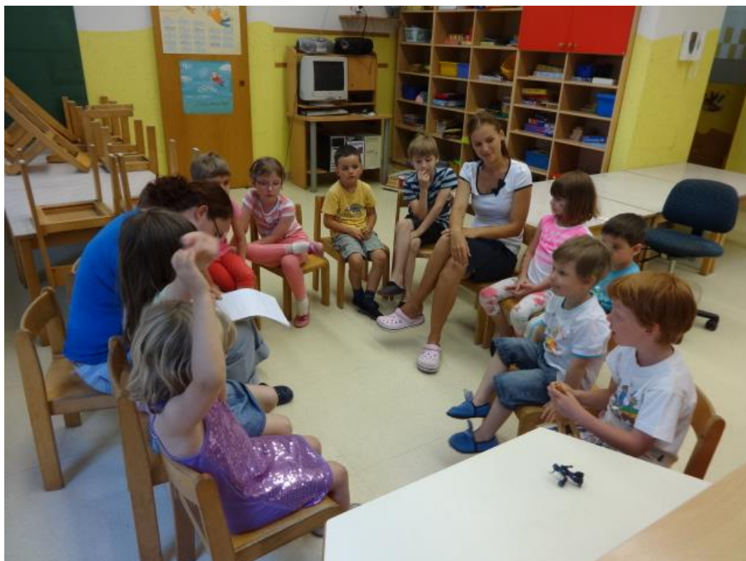
Slika 7.2: Pogovorni krog na temo, kaj bi radi delali med poletjem

Da bi imeli vsi priložnost povedati svoje ideje, sem med igračkami vzela plastičnega konja in rekla, da govori tisti, ki ima v rokah konja. Ko pove svojo idejo, preda konja naslednjemu otroku. Tako je konj najprej prepotoval cel krog, ideje so se vrstile, jaz pa sem jih zapisovala. Ko je bil krog zaključen, sem vprašala, če ima kdo še kakšno idejo. Zdaj se je konj selil k tistim otrokom, ki so dvignili roko, da imajo še kakšno idejo. Največ idej so imeli seveda najstarejši otroci.