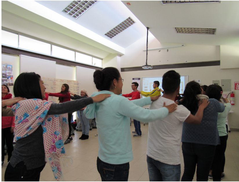
Figura 2: Dinámica de tacto y contacto