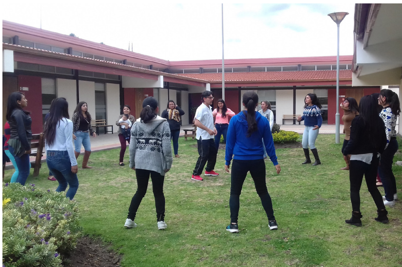
Figura 3: Ritmo, movimiento y percepción (autónoma y colectiva)