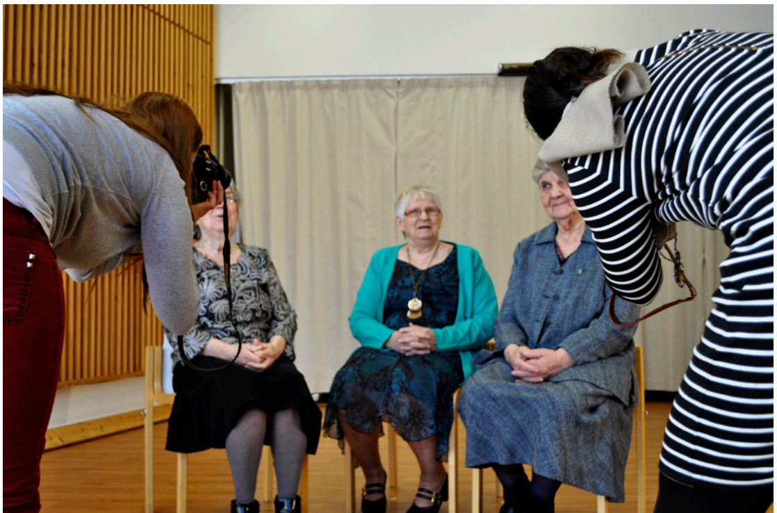
Kuva 13. Naiset kuvattavina.

liin saapuessa alettiin keskustella juhlavaatteista ja tärkeää oli, että myös me olimme pu- keutuneet juhlavasti. Rakensimme studiota niin, että vanhukset olivat paikalla ja mukana ihmettelemässä sekä keskustelemassa aiheesta. Meillä oli ajatus kuvata veteraaneja pie- nissä ryhmissä ja ryhmiksi muotoutui naisten ja miesten ryhmät. Jälkeenpäin pohdimme, johtuiko se naisten ryhmittymisestä vertailemaan mekkoja vai onko ennen ollut niin ta- pana vai oliko se vain luontevampi niin. Naiset käyttivät toisiaan peilinä: onko hiukset hyvin ja onko kuvassa sen näköinen kuin pitää. Tärkeää oli keskustelu, joka rakentui ku- vauksen ympärille vanhan ajan valokuvauksesta tähän päivään. Lähekkäin ryhmiin aset- tautuneena henkilökuvien ottaminen oli luontevaa eikä kenenkään tarvinnut olla kuvatta- vana yksin. Veteraani, joka oli alun perin kieltäytynyt valokuvaan tulemisesta, ilmoitti heti päivän aluksi: ”En ole lähdössä täältä minnekään!” ja ”Aion tulla myös huomenna.” Päivän päätteeksi hän vielä varmisti ”Nähdäänhän sitten huomenna... Voisin laittaa toi- sen mekon huomenna.” Oli tärkeää, että hän koki olonsa erityiseksi: ”Mehän ollaan kun filmitähtiä! Ja huomenna taas ollaan filmitähtiä!” (ks. kuva alla)