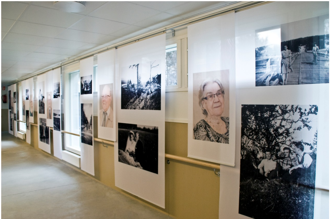
Kuva 41. Valokuvallinen yhteisötaideteos. Kuvaja: Eeva Vanhanen

Hiltusen ja Jokelan (2014) mukaan yhteisö- ja paikkasidonnaisen taidekasvatuksen keskiössä ovat yhteisön tuottamat ja heidän kulttuuristaan nousevat merkitykset suhteessa paikkoihin. Yhdessä tuotetut paikkasidonnaiset taideteokset synnyttävät osallisuuden tunnetta, joka on edellytys voimaantumiseksi ja omiin kykyihin ja vaikutusmahdollisuuksiin luottamiselle. ” Omaan elämismaailmaan kiinnittyvä taidetoiminta synnyttää pysyvää tunnetta tiettyyn paikkaan tai yhteisöön kuulumisesta. ” (Hiltunen & Jokela 2014, 87.)