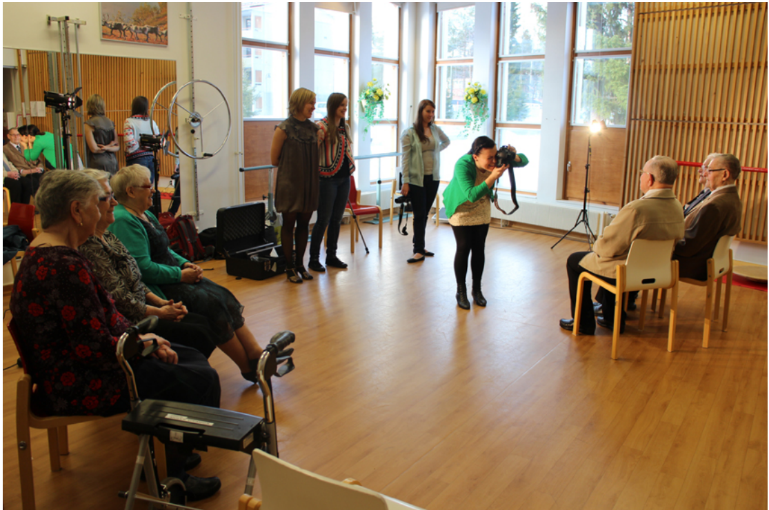
Kuva 15. Yhteisöllinen valokuvaaminen.

digitaalisuus mahdollisti suuren kuvamäärän ottamisen ja sai veteraanit ihmettelemään heidän kuvausajan kautta saamaansa huomiota. ”Miten sinä noin monta kuvaa minusta otat?” Veteraanit toivat kuvaustilanteeseen omaa persoonaansa. Emme ohjanneet veteraaneja vaan jokainen sai asettua hänelle luontaisella tavalla kuvaan ja ottaa kontaktia kuvaajaan haluamallaan tavalla. Eräälle veteraanille kuvan arvo oli sen virallisuudessa ja toiselle iloisuudessa. Valokuvaajana tuli löytää oikea hetki ja herkistyä saamaan kuvaan myös henkilön persoona. Kuvauspäivän jälkeen kyseltiin, koska nähdään uudestaan ja oltiin hieman huolissaankin, ettei oma kuntoutus mene valokuvien katselun kanssa päällekkäin.