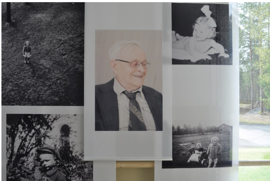
Kuva 22. Lapsuus.