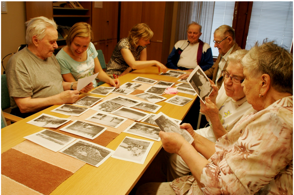
Kuva 17. Valokuvien teemoittelua.

Puhe oli päällekkäistä ja innostunutta. Hyvä, että saimme sanottua mitään väliin. Kaikki keskittyivät innoissaan kuviin ja niiden kanssa työskentelyyn. (ks. kuva alla) Osasta vanhuksista pystyi lukemaan, kuinka innoissaan oltiin ja, että taas tulee jotain kivaa. Kuvat kulkivat kädestä toiseen ja puheensorina oli taukoamaton. Syntyi erikokoisia keskusteluryhmiä ja osa palautui muistoihin. Toiminnantäyteen kerran päätteeksi kaikki kuvat