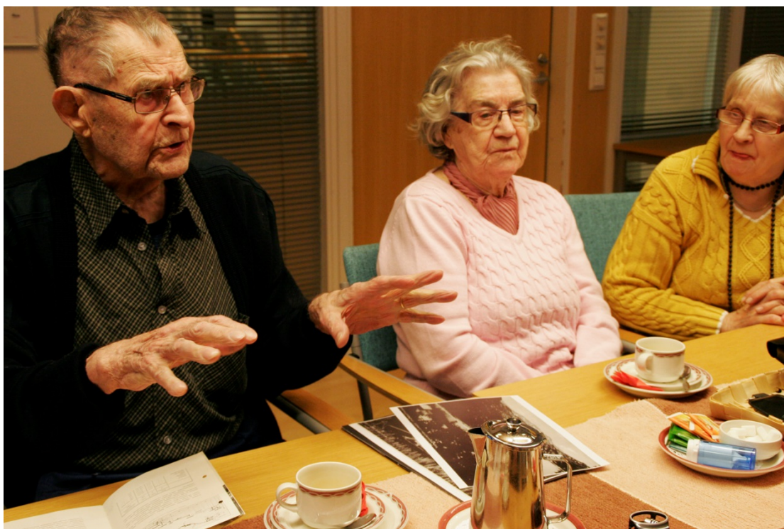
Kuva 10. Luovaa valokuvallista muistelutyötä.

Tarina alkoi vanhasta valokuvasta, mutta saattoi päätyä hyvinkin kauas siitä mistä alkoi. Kuvakertomus rönsyili, kasvoi, poukkoili, haarautui ja yllätti välillä vanhuksen itsensäkin. Kuva oli puheenvuoro, jonka kautta vanhus pääsi kertomaan ilman rajattuja kysymyksiä tai toivottuja vastauksia. Kuvan kautta muistisairaskin vanhus voi kertoa mistä vain kuvaan liittyvästä asiasta. Kertomus saattoi poukkoilla ajallisista tapauskuvauksista niiden merkitysten analysointiin, kuten myös Kohtamäen ja Palomäen (2010) tutkimuksessa. Välillä oltiin itsekkin yllättyneitä siitä, kuinka paljon juttua tuli ja kuvasta muistettiinkaan. Varmasti osa oli miettinyt etukäteenkin mitä kuvasta kertoo. Pidimme kuvakerontaan liittyvää valmistautumista ja jännittämistä myös vanhalle ihmiskehölle tärkeänä. Heidän tuli luottaa omaan puheeseen ja kertomukseen. Tilannetta laukaisi usein, että joku muukin alkoi kertoa ja muistella samojen esille tulleiden asioiden myötä, eikä kuvasta kertoja päässyt itse aina loppuunkaan. Näimme tärkeäksi myös pinnistelyn ja esiin nousemisen muiden vanhusten joukosta. Haasteita ja itsensä likoon laittamista on palvelutalossa vähän. Myös Liikasen (2003, 112–128) tutkimuksessa iäkkäät kaipasivat haasteita ja toiminnallisia ”ponnisteluja” arkeensa.