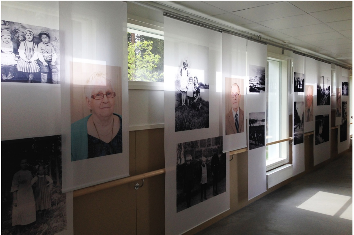
Kuva 31. Kuvakokonaisuus.