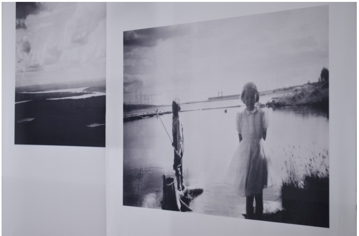
Kuva 20. Kuvakokonaisuus käytävän mutkassa. Lapsuus.