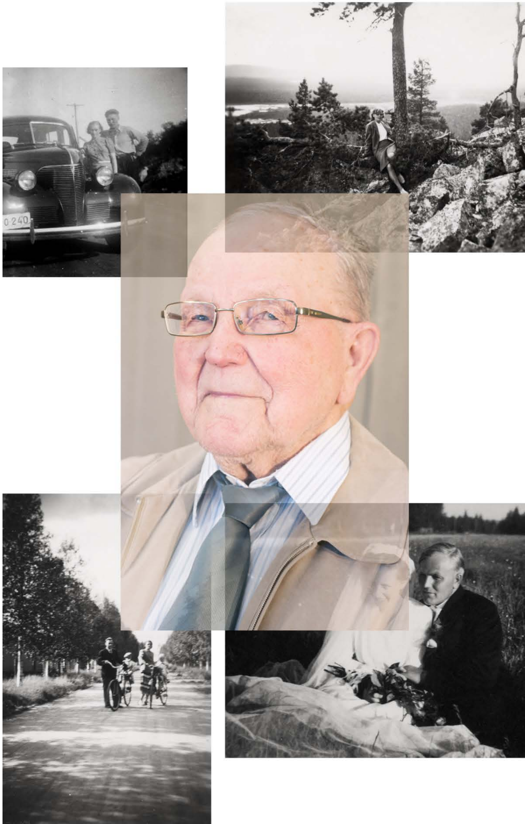
Kuva 28. Kuvakollaasi. Vanhuus.