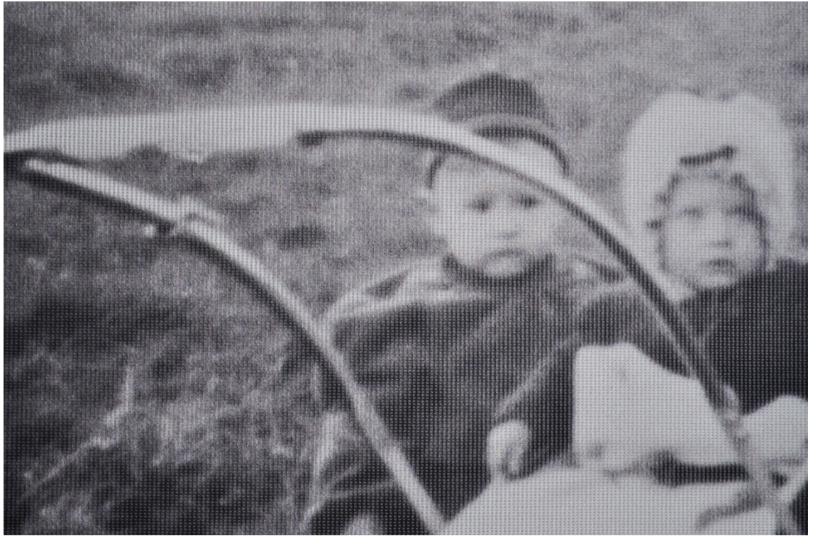
Kuva 19. Yksityiskohta: kankaan tekstuuri. Lapsuus.