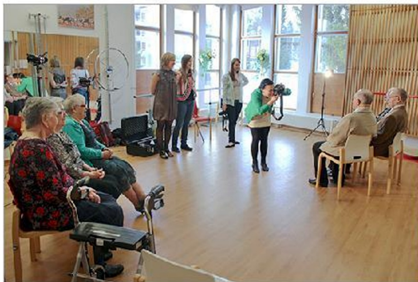
Veteraanien valokuvaaminen yhteisötaideteokseen.