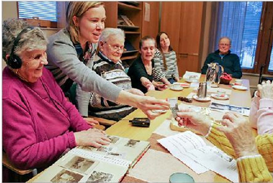
Kollektiivista valokuvallista muistelutyötä veteraanien kanssa.