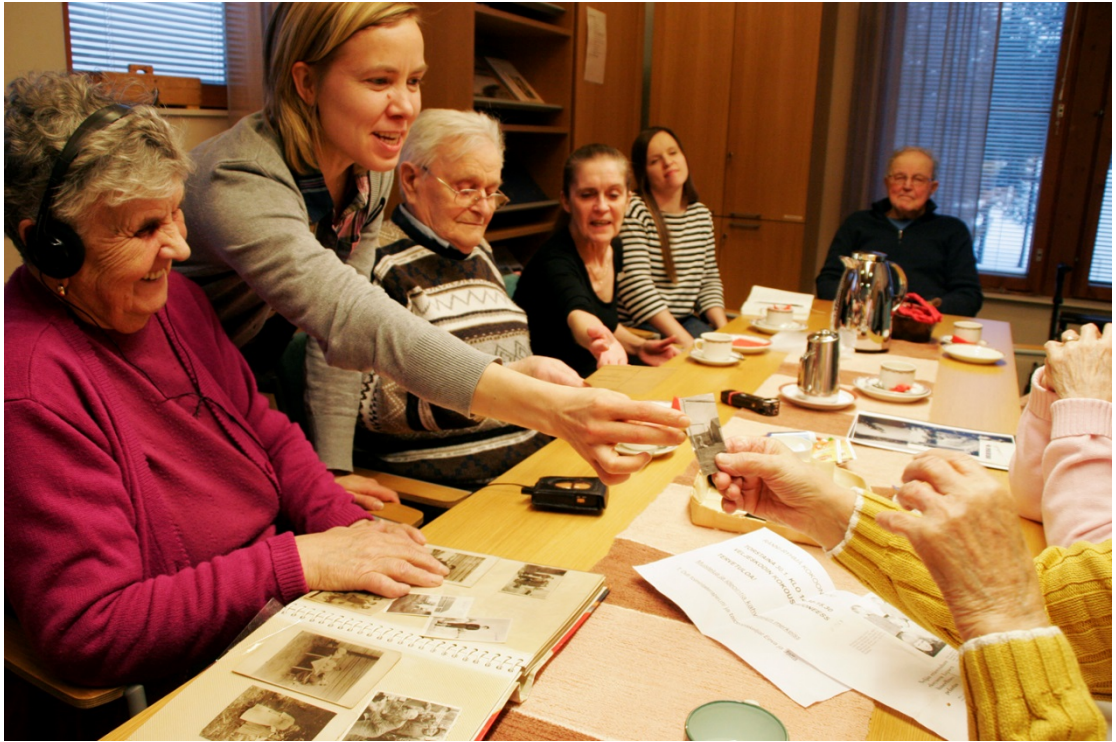
Kuva 34. Kollektiivista valokuvallista muistelua.