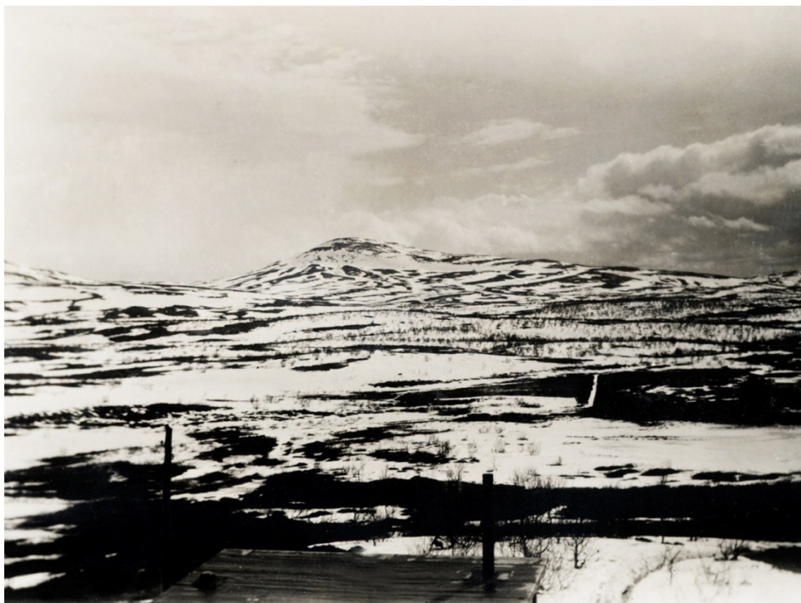
Kuva 43. Tunturimaisema Lapissa.