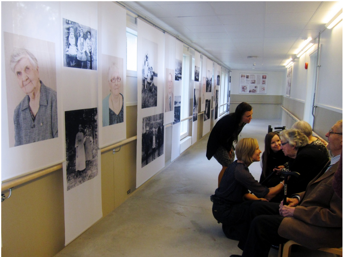
Kuva 40. Meidän porukka avajaisten jälkeen.

Liikasen (2003, 154–155) mukaan ammattikuntien tulisi tutustua toisiinsa ja lisätä yhteisiä voimavaroja juuri käytännön toiminnassa. Myös Liikasen tutkimuksessa pidettiin tärkeänä, että asiakkaan taide- ja kulttuuriharrastuksia tuetaan ja niiden on mahdollista jatkaa myös hoitoyksiköissä.