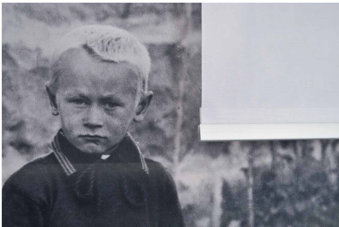
Kuva 21. Yksityiskohta teoksesta. Lapsuus.