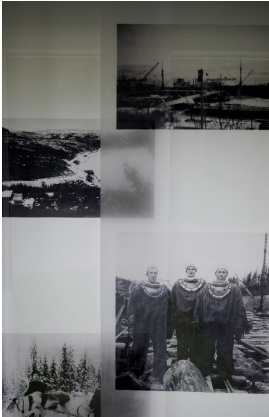
Kuva 24. Osakuva. Aikuisuus.