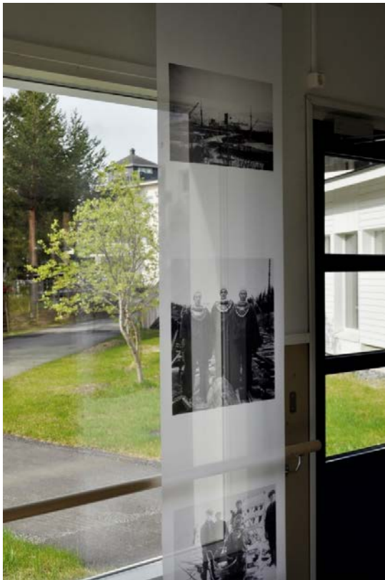
Kuva 25. Osakuva. Aikuisuus.