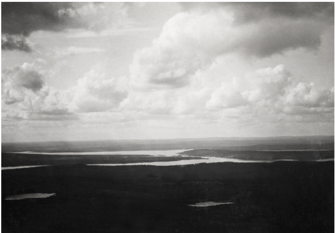
Kuva 4. Maisemakuva Lapista.

Ensimmäisessä teoriaosissa kuvaamme valokuvan paikkaa nykytaiteessa. Lähestymme valokuvaa tilallisena, sosiaalisena sekä voimauttavana elementtinä. Kirjoitamme valokuvasta myös luovana muistelutyön välineenä sekä kuvaamme valokuvan ja muistelun ympärille rakentuneita luovia ja taidemenetelmällisiä tutkimuksia. Valokuvallisuus ja valokuva herättivät keskustelua heti ensimmäisellä veteraanien tapaamiskerralla. Yhteisötai-deprojeektimme lähti rakentumaan heti alussa kohti valokuvallisia menetelmiä.