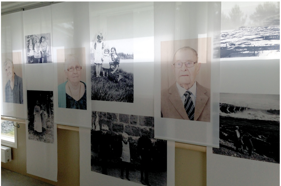
Kuva 30. Osakokonaisuus.