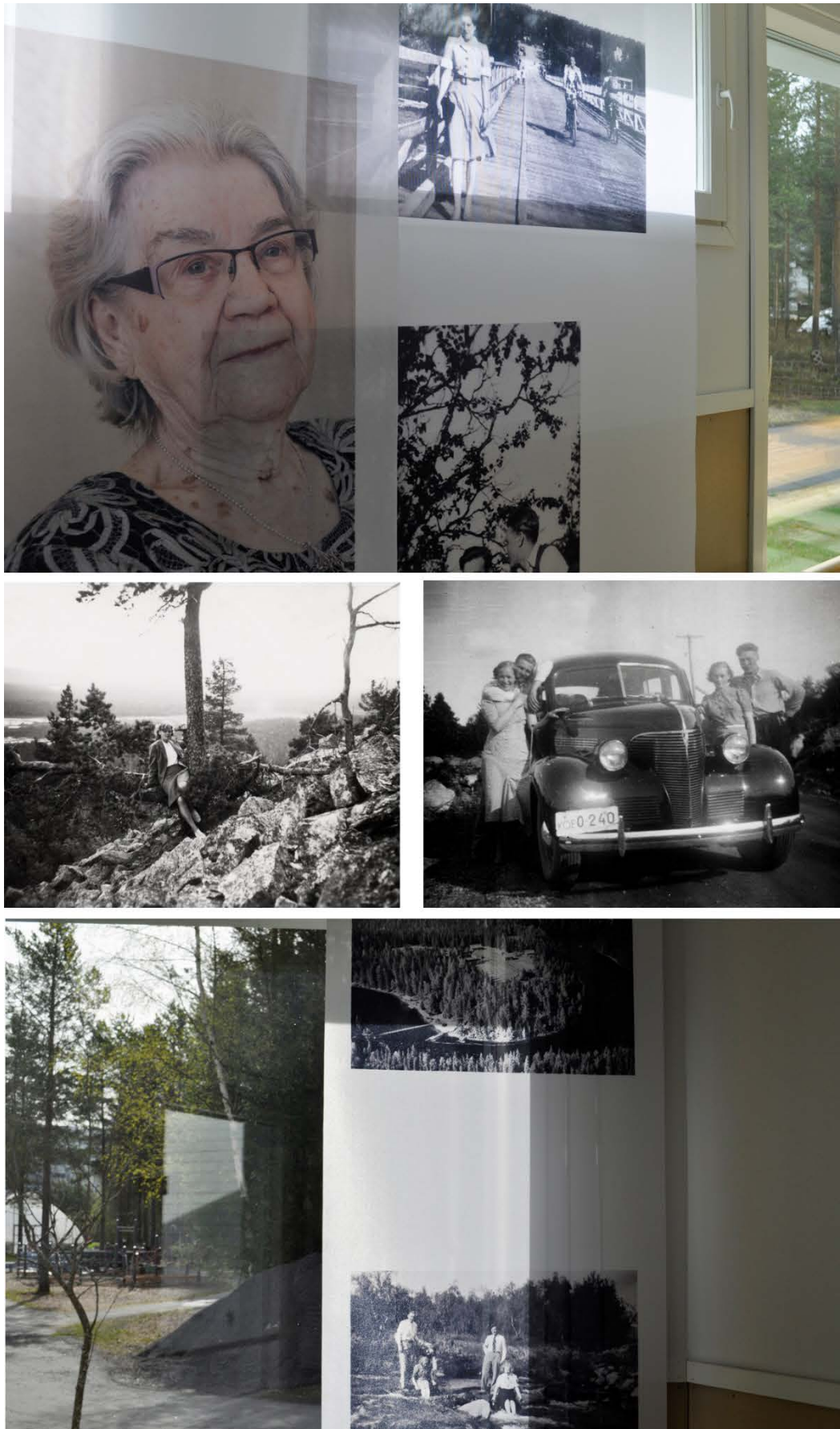
Kuva 23. Kuvakollaasi. Nuoruus.