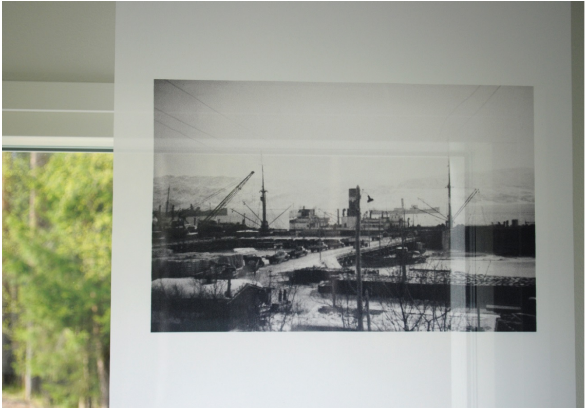
Kuva 26. Yksityiskohta. Aikuisuus.