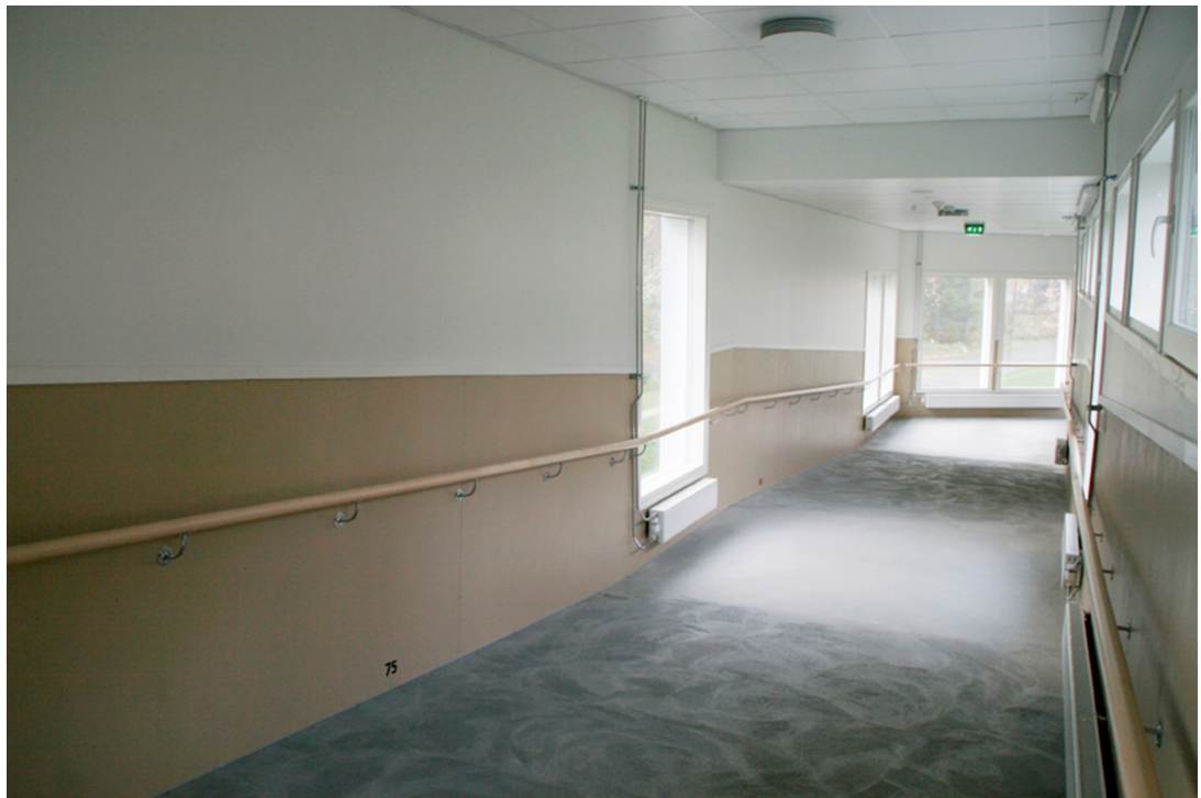
Kuva 2. ja 3. Yhdyskäytävä Ränni Veljeskodin ja Kuntoutus Oy:n päädystä.