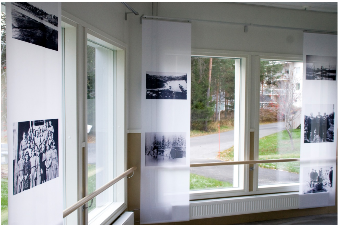
Kuva 27. Kuvakokonaisuus. Aikuisuus.