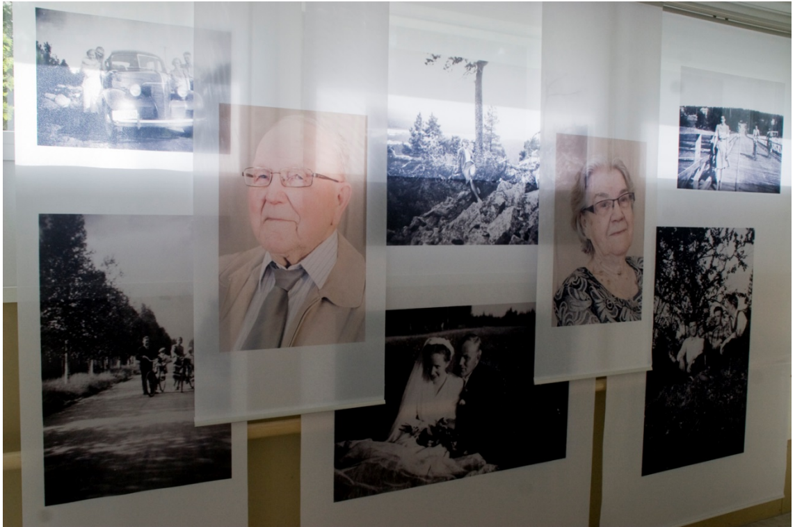
Kuva 29. Osakokonaisuus.