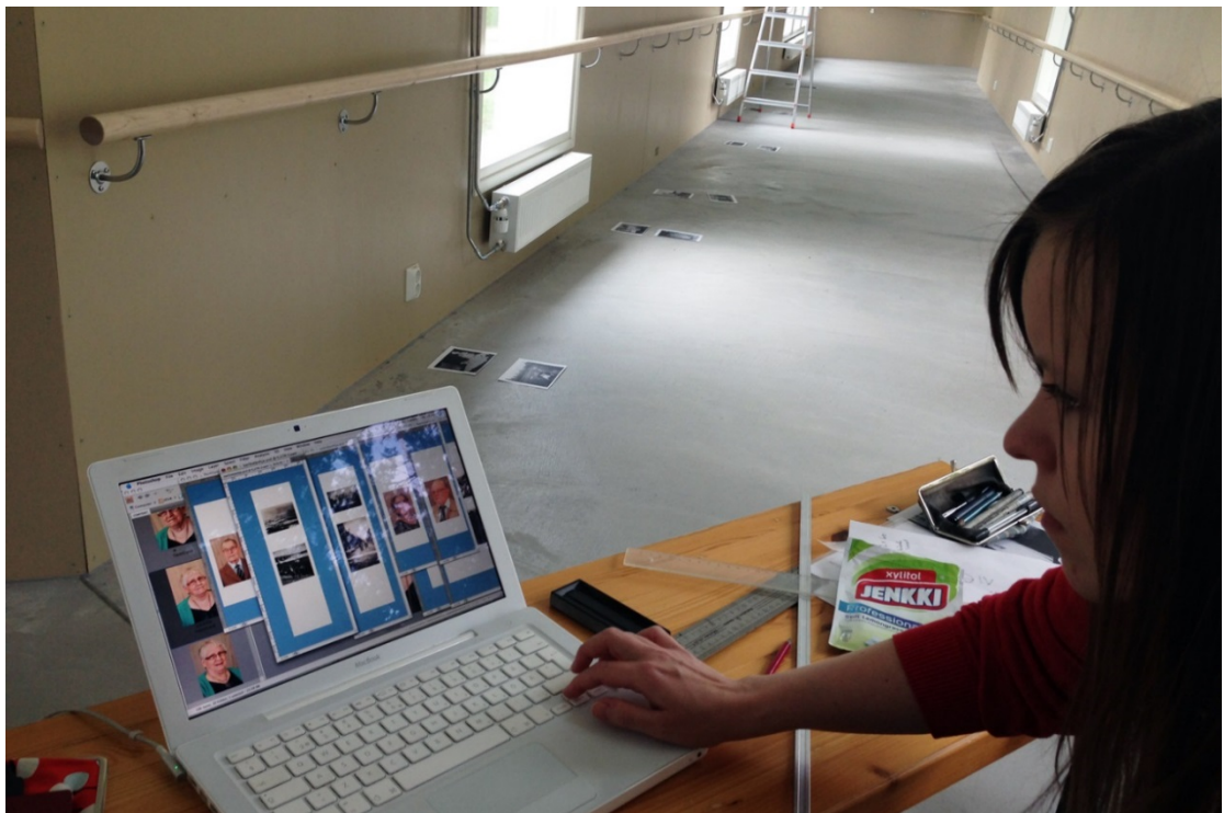
Kuva 18. Kuvien taittoa verhopohjille yhteissuunnittelun pohjalta.

yhdyskäytävään kaikki materiaali mukanamme. Lähdimme liikkeelle vanhusten kanssa yhteisesti suunnittelemistamme teemoista. Asetimme kuvat, joita käytimme teemoittelussa elämänkaareksi käytävän lattialle. Intuitiivisesti kuvat hakeutuivat paikoilleen projektissa käsitellyn dialogin pohjalta. Kaikista vanhoista kuvista tehtiin niin suuria kuin pystyttiin. Pienimmät kuvat olivat hieman tulitikkuaskia suurempia. Pystyimme suurentamaan niitä 50x50cm kokoisiksi. Osa rakkaimmista kuvista oli kulkenut lompakossa vuosia ja ne olivat repeilleet ja taittuneet. Joissakin kuvissa saattoi olla kahvitahroja. Tällaisia kuvia jouduimme käsittelemään tietokoneella. Vanhimmat kuvat olivat jopa 85 vuotta vanhoja. Osa kuvista sävyt olivat saattaneet haalistua. Käsittelimme vanhoja kuvia jonkin verran mutta niin, että kuvan arvokkuus otettiin huomioon. Päätimme, että verhoja on kahta kokoa, koska osa suurennetuista kuvista kesti suurentamista ja niistä lähti rakentumaan 120cm verhoja mutta osa kuvista jäi 50x50cm kokoon. Aikaisemmin olimme myös päättäneet, että verhot kulkevat kolmessa kerroksessa, jotta ne olisivat liikuteltavissa ja visuaalisesti ilmentäisivät muistomaisuutta. Osittain myös saatavilla olevat kiskot ja listat määrittivät tilateoksen verhojen leveyttä. Jokainen verho suunniteltiin ja mitattiin omalle paikalle käytävään ja huomioon otettiin kerroksellisuus. Kaiken tämän pohjalta asetimme kuvat verhon kokoisille pohjille tietokoneelle. (ks. kuva alla)