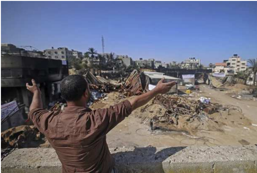
Een Palestijnse arbeider overschouwt vernielingen van de bombardementen in Beit Lahiya, een stad in het noorden van de Gazastrook (26 mei 2021)

'Om dit koloniale geweld een halt toe te roepen is er ook een staakt-de-blokkade, een staakt-de-bezetting en een staakt-de-apartheid nodig', schrijven Koenraad Bogaert, Itamar Shachar en Sigrid Vertommen van de UGent.