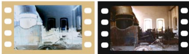
Figura 2 Negativo (izquierda) y positivo (derecha).

Si se ha editado utilizando una posproducción digital a través de un telecinado del negativo, se utiliza la EDL ( Edit Decision List ) para conocer el minutaje del negativo original.