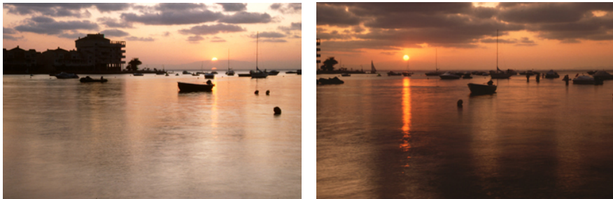
Figura 4 Toma sin filtro (izquierda) y con filtro degradado naranja (derecha)

Hay que tener en cuenta que el filtraje en la toma está bien en tanto en cuanto tengamos claro el efecto o look que queremos. Sin embargo, hay que ser conscientes que si no tenemos claro el efecto que queremos conseguir el etalonaje no puede eliminar los efectos de algunos filtros, como los degradados. Si por ejemplo utilizamos un filtro ámbar en cámara, y luego tratamos de anular su efecto en etalonaje, todas las sombras tendrán una dominante azul, porque la capa del azul ha sido alterada en el negativo en el momento de la exposición, así que al intentar corregir ese color los negros perderán fuerza en los valores bajos, reduciendo su contraste.