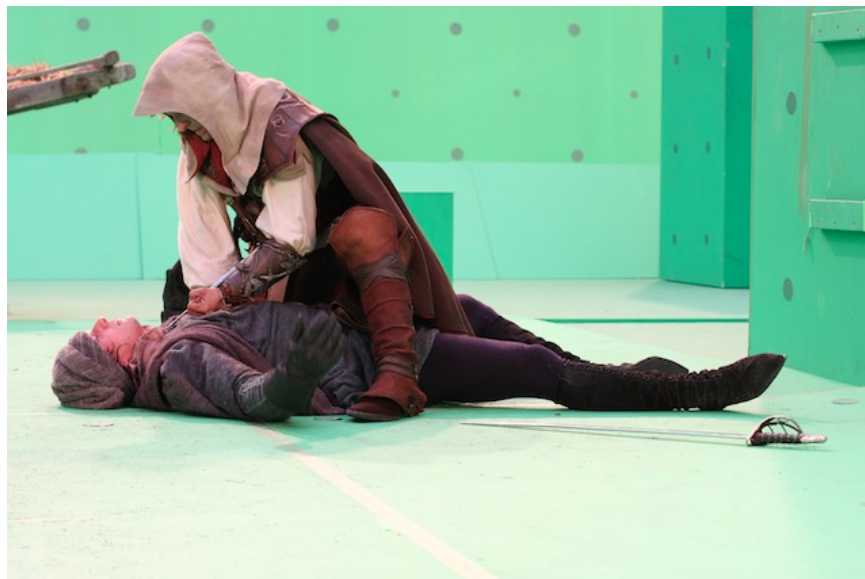
Fig. 1 : L'hybridité technologique entre cinéma et jeu vidéo sur le plateau de tournage d' Assassin's Creed: Lineage . Image gracieusement mise à notre disposition par Ubisoft.

Nous proposons d'aborder dans cet article la question des rapports entre le jeu vidéo et le cinéma à travers une étude de cas spécifique : la franchise Assassin's Creed . Plus particulièrement, nous nous questionnerons sur le rôle que joue la trilogie de courts métrages Assassin's Creed: Lineage (2009), réalisés par Yves Simoneau et Hybride Technologies, et diffusés gratuitement sur YouTube dans le but de stimuler l'intérêt des joueurs avant la sortie d' Assassin's Creed II (Ubisoft Montréal/Ubisoft, 2009). Nous verrons que, loin d'agir comme simples outils promotionnels, les films capitalisent sur les forces du cinéma et contribuent au déploiement de la franchise. Cela ne peut toutefois se produire sans frictions. Nous montrerons comment le modèle transmédiatique constitue le prolongement de la remédiatisation et pourquoi il s'avère être une meilleure option au final. Mais d'abord, pour bien saisir la spécificité de notre propos, il convient de s'intéresser au contexte plus large dans lequel ces objets, ces pratiques et ces réflexions s'inscrivent.