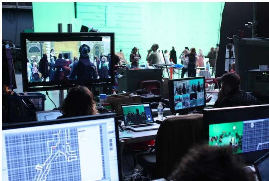
Fig. 4 et 5 : Profilmique et hors-cadre : tournage de Lineage sur fond vert, avec prévisualisation des décors numériques tirés du jeu. Images gracieusement mises à notre disposition par Ubisoft.

Selon le réalisateur Yves Simoneau, Ubisoft avait laissé une grande liberté aux artistes du 7 e art en ce qui concerne Lineage ; la trilogie devait suivre deux directives : introduire la conspiration, qui est au centre de l'intrigue d' AC2 , et montrer l'importance de la famille [14]. Si les films remplissent en général très bien ces mandats, il importe de se livrer à une courte analyse pour voir comment et le film et le jeu contribuent « à la dissémination du sens par leurs frictions et croisements », pour reprendre notre définition de la transmédiatité.