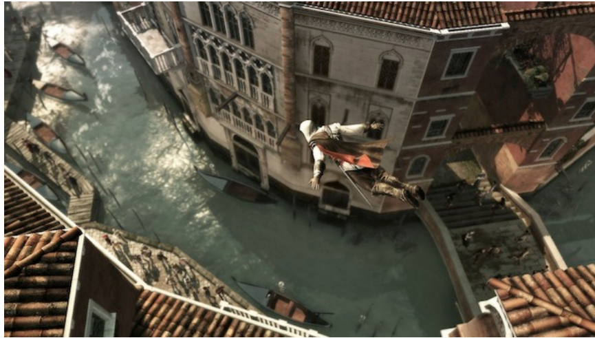
Fig. 2 : Ezio Auditore plongeant dans un canal de la Venise simulée dans Assassin's Creed II .

différence d'ordre ontologique, le 7 e art étant fondé sur le paradigme de captation/restitution, tandis que le 10 e procède d'un tout autre régime : celui de la simulation, à la base de l'animation 3D comme du jeu [4].