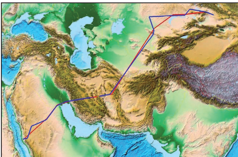
Рис. 2. Четырёхлетняя самка орла-могильника с РТТ 23671 в 1995 г. затратила 3,5 недели на свою весеннюю миграцию в Китай, протяжённостью 5 тыс. км, и 1 месяц на осеннюю миграцию в Западную Аравию. Она провела 6 месяцев на своём летнем участке в Синьцзяне (Китай) и 4,5 месяца в зоне зимовки.

On 23 November 2003 an ad. male was the first bird to be fitted with a GPS-enhanced РТТ (ID 39587) and tracked until 17 February 2004 which made it possible to study its wintering behaviour in great detail. Its home range was 5,900 km 2 in area with a diameter of up to 127 km. It was most often on the wing between 15.00 and 17.00 hrs (local time). It removed the GPS tag, which was found on the ground, while still in the wintering area.