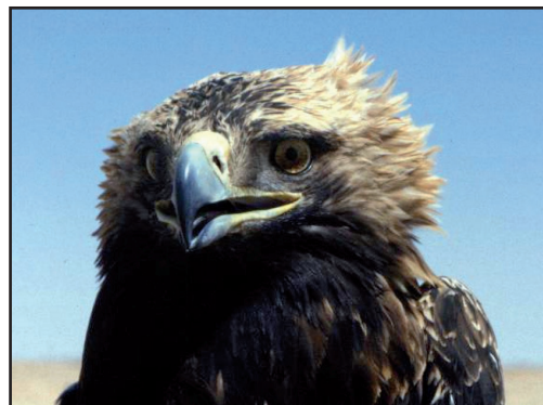
Взрослый самец орла-могильника ( Aquila heliaca ) 26047 из Казахстана.

Эта самка орла провела шесть месяцев в летнем местообитании в Синьцзяне (Китай) и 4,5 месяца (6 апреля – 9 сентября 1995 г.) на зимовке площадью 1360 км 2 (80% мини-