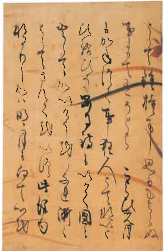
図4 謡本『三井寺』切 素庵書写

平成19年、京都市内の古典籍舗に出現した鈔写謡本『三井寺』の断簡「として鐘撞可、……明月に向て、心を」は初見、後藤本切かと思われた(図4、個人蔵)。具引き料紙(雁皮紙)を合剥ぎした半丁分の断片で、他に例のない珍しい金銀泥肉筆「蘭図」の下絵がある。それは後藤本『藍染川』の金銀泥肉筆下絵「薄図」と同一の流麗な筆致を示す。新出切も俵屋宗達の筆になるものと思われる。本文は後藤本と同じく七行書きで丁寧に書写され、その「かな書体」は『藍染川』の書体とまったく同じである。すなわち、謡本『三井寺』もまた素