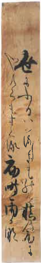
図1 素庵筆「和歌短冊」

近年、素庵の「かな書体」の基準作品が発見された。『新古今集和歌短冊<世にふるは>』（図1）がそれである（個人蔵）。本紙は雁皮紙、縦36.0cm、横5.7cm。金銀泥肉筆で葦の生えた水辺の情景が下絵として描かれている。伝統的な装飾料紙である。その上に、二條院讃岐の和歌「世にふるはくるしきものを楨の屋に やすくもすくる初時雨かな」がたっぷりとした墨で揮毫されている。起筆において尖筆が左上から鋭く入り、漢字は太く、かな文字は極端に細く、抑揚に変化をつけ、律動的な流れを見せ、装飾性豊かな筆跡である。親しみのある書体である。本紙は合剥ぎされているが、さいわい、かつて本紙裏面に依頼者が書き込んだ揮毫者名「角蔵与一殿」の裏書は切取られて、短冊裏面（裏打ちなし）の右下隅に貼られている（図2）。この裏書は、短冊の揮毫者が素庵であることを証明する。「角蔵」と書くのは、慶長12年（1607）以前といわれているので（『板倉政要補遺』巻四、慶長12年の頃）、この短冊は慶長10年前後のものと思われる。