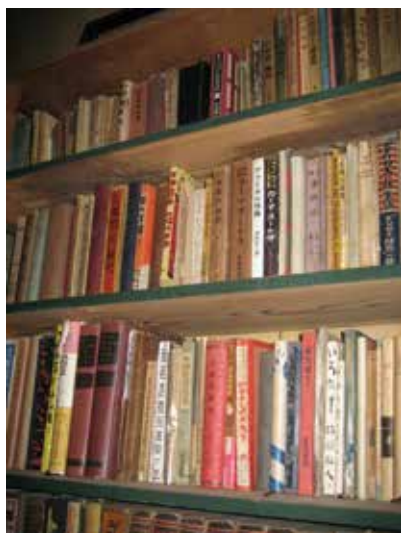
写真10 森羅万象窟の書棚

一部屋を「森羅万象窟」とも「奥の院」ともよんで、性崇拜の蒐集や研究、道楽絵はがきや判じ絵作りなどを楽しんだ。