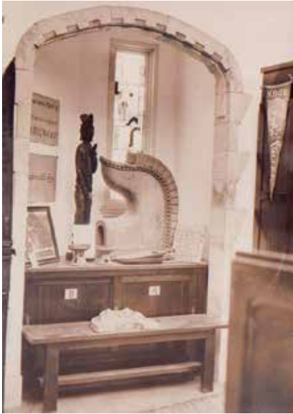
写真5 開館当時の館内