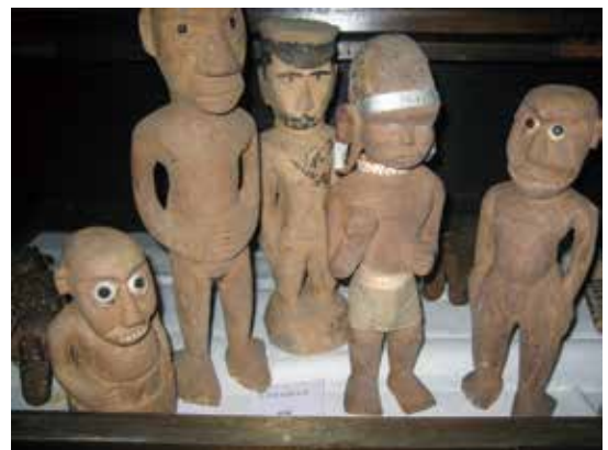
写真9 南洋民族資料の展示

展示物は、大きく分けて三つに分類される。一つは日本の民俗資料。二つは外国の民俗資料。三つは森羅万象窟（九十九黄人の研究室）。その数はざっと1万点。展示資料は91年前の開館当時とほとんど変わっていない。展示の仕方や展示物の解説もほぼ当時のままである。学術的な意味があつて系統だてて展示しているかどうかは分からないが、専門家によると、開館当時のままの学術的意識を保った展示は、博物館史的・人類学史的に興味を引かれるという。