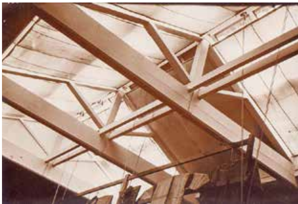
写真6 開館当時のガラス屋根