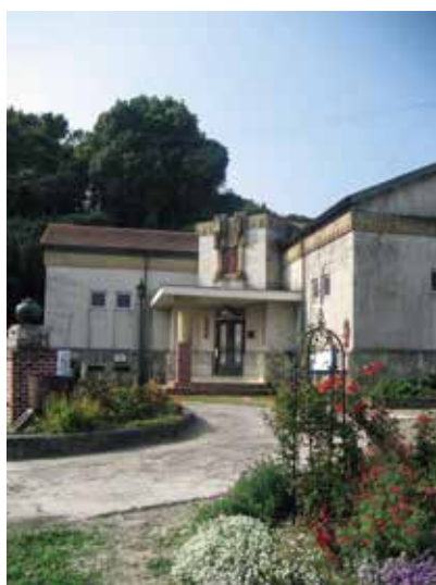
写真1 東洋民俗博物館

私が運営する東洋民俗博物館は、1928（昭和3）年開設以来、わが母校の関西大学や奈良県下の諸館園と様々な交流があった。そこで、東洋民俗博物館の92年の歴史や主な展示品の紹介とともにその関係について紹介する。