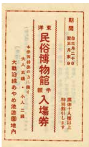
写真3 東洋民俗博物館と榎原考古館のパンフレット