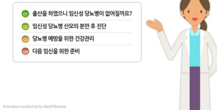
Figure 2. Hi chart video significant screen.

대조군의 사전 조사는 2017년 6월부터 10월까지 진행되었다. S병원 산부인과에서 출산 후 입원해 있는 임신성 당뇨병 산모에게 연구의 목적, 참여기간, 절차 및 방법, 예상되는 위험 및