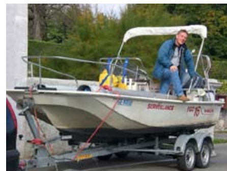
YCC puts the fleet away.

Many thanks indeed to all those stalwarts who turned up to put the fleet away on Saturday 16 October. It started chilly but then ended up a lovely Autumn day, and the whole Port Choiseul section was completed in a comfortable three hours. Thanks also to Haude and her team for the refreshments, those who got Karcher-soaked cleaning ResQ's hull, and to the owners of trailer-hooked cars who kindly volunteered to trundle the fleet back to BA 5.