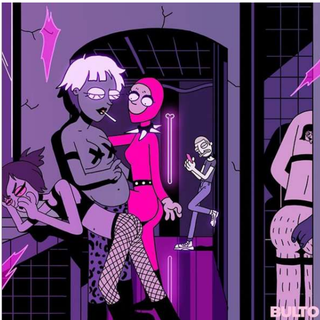
Ilustración 10/12, el chico sin cabello de pan, @Bulto.co, 30 de marzo de 2020.

Antes de empezar a diseccionar la pieza, es necesario dar un poco de contexto. Esta ilustración aparece a finales de marzo del año 2020 en una serie de imágenes luego de una gran fiesta que realizó el colectivo Bulto . Un encuentro que había prometido varias experiencias y una noche inolvidable que giró en torno a la comunidad LGBTQ+ y una excelente selección musical (Atencia, 2020). Las piezas fueron realizadas por “ el chico sin