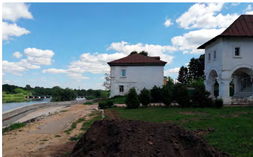
^ Рис. 4. Гороховец. Историческая набережная. Фото С. В. Зеленовой, 2019

– организация пешеходной зоны в исторической части позволяет создать представительскую набережную – для туристов;