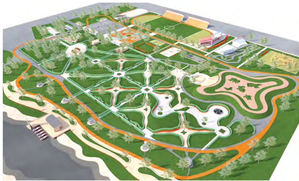
^ Рис. 11. Проект парка в г. Первомайск. Архитектурная мастерская ННГАСУ, проект 2019

истории и общества. На логике этой взаимосвязи формируются культурные ландшафты, задающие неповторимый контекст. Это характерно именно для малых городов, сохраняющих свою идентичность рядом с крупными городами, неизбежно в большей мере задетыми процессами глобализации. Но главный контекст – это человек, и лишь востребованное человеком поселение будет жить и развиваться, поэтому так важно использовать весь спектр средств вовлечения адресата в жизнь города. И тогда город никогда не станет «Пропадинском».