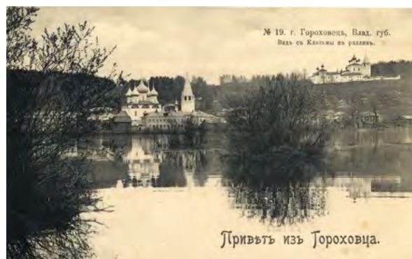
в Рис. 1. Гороховец. Вид с Клязьмы в разлив. Открытка.

В качестве одного из решений проблемы оттока населения из малых городов и исторических поселений предлагается организация общественных пространств, востребованных различными адресатами. Общественные пространства трактуются как типологическая единица архитектурной среды, в которой находят свою синтетическую взаимосвязь природные, исторические и социальные особенности конкретных поселений. Исследуются набережные, улицы, площади и парки малых городов, предназначенные для коренного жителя и гостя города. Анализируются зарубежный и отечественный проектный опыт, в том числе проекты, выполненные в рамках конкурса «Малые города и исторические поселения». Ключевые слова: адресат; общественное пространство; малый город; историческое поселение; потенциал. /