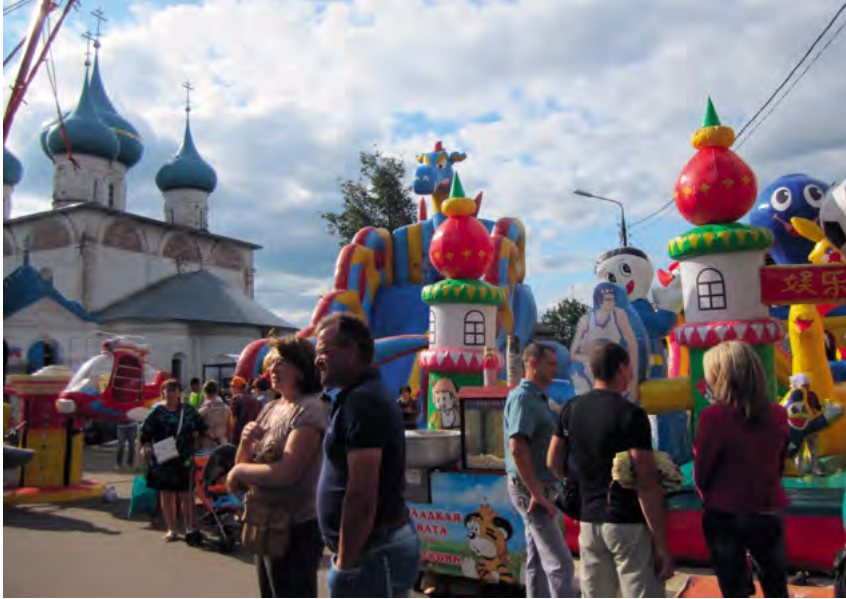
^ Рис. 6. Гороховец. День города 2014