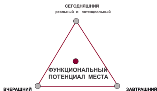
< Рис. 5. Схема смены адресатов архитектуры [2]

Выявив постоянного жителя и гостя города как главных адресатов архитектуры малых исторических городов, отметим, что в более ранних исследованиях авторов статьи указывалось на целесообразность рассмотрения нескольких систем адресатов как во временном, так и в событийном смысле (Рис. 5). Так, сегодняшний, вчерашний и завтрашний адресаты могут быть реальными и потенциальными [5]. Поясним эту мысль на примере востребованности общественных пространств. Общественное пространство имеет конкретное функциональное наполнение для конкретной целевой группы, потребительской аудитории, заказчика; и это прямой,