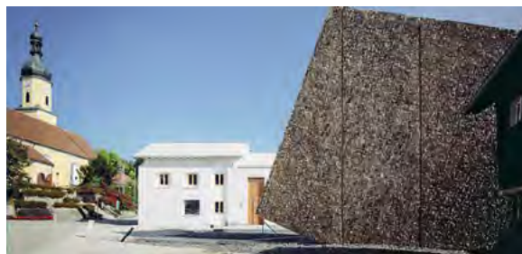
< Рис. 9. Концертный зал в г. Блайбах (Германия), 2016. Арх. бюро Питер Хаймер [9]

П. А. Александров в диссертационном исследовании «Русские административные здания и их роль в формировании площадей» указывает, что с точки зрения социальной административное здание занимало в дореволюционной России второе или даже третье место на главной площади, после собора и дворца. С точки зрения образной канцелярское здание было чисто утилитарным, даже безликим, т. к. на площади уже имеется центр композиции, «образ западноевропейской ратуши, к которому неоднократно обращались в российской практике, не получил, однако, «права гражданства» в России, вероятно,