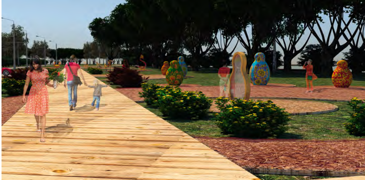
< Рис. 8. Благоустройство ул. Заводской в г. Семенов Нижегородской области. Архитектурная мастерская ННГАСУ, проект 2018–2019, начало реализации 2019

Лукоянов (14136 чел.), Ворсма в Нижегородской области, поселки городского типа Шатки Нижегородской области, Умёт (2600 чел.) в Zubovo-Полянском муниципальном районе республики Мордовия на федеральной трассе М-5 «Урал». В данном случае получается, что основной адресат общественного пространства, которое складывается вдоль такой улицы-трассы, – водитель или пассажир транспортного средства, а наиболее востребованные общественные здания – придорожные объекты обслуживания. Так, Умёт известен учреждениями питания: более пятисот кафе размещаются вдоль дороги на участке протяженностью примерно 2 км, работа в них – один из основных видов деятельности населения поселка. В какой-то степени такое развитие – полная противоположность пешеходным историческим торговым улицам, которые развивались от рыночных площадей к реке как основной транспортной коммуникации, а сейчас служат самым востребованным общественным пространством для туристов.