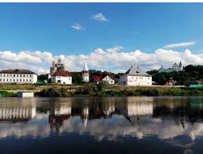
^ Рис. 3. Гороховец. Вид с Клязьмы. Фото С. В. Зеленовой, 2019