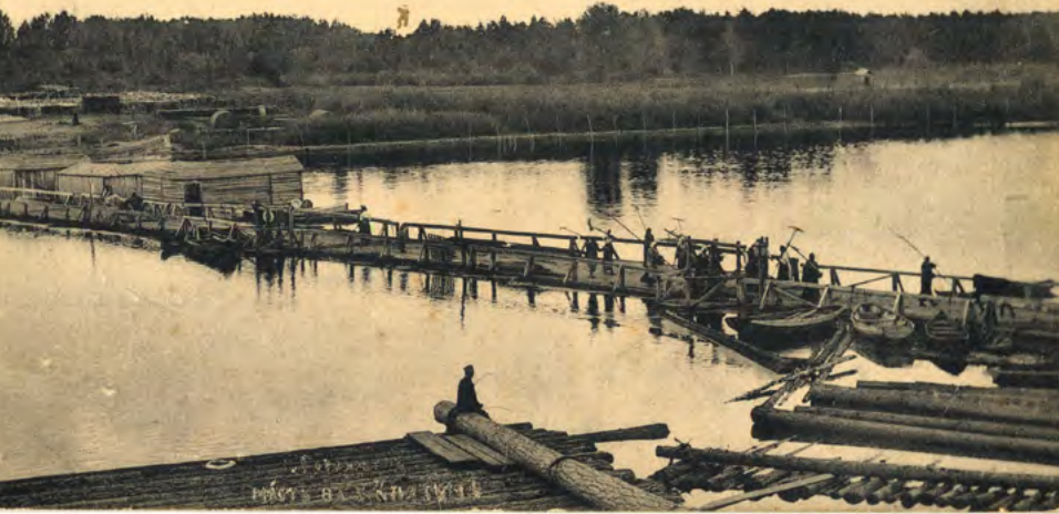
< Рис. 2. Гороховец. Мост на р. Клязьме. Открытка.

ал. Вероятно, социально-экономические условия как неотъемлемая часть обозначенного процесса тормозят его развитие. В малых городах это выражается прежде всего в традиционной простой схеме: молодой коренной житель уезжает учиться в крупный город и не возвращается на малую родину ввиду отсутствия градообразующих предприятий. При этом очевидными проблемами выступают отсутствие функциональности, событийности, а также сложный процесс вовлечения населения в вопросы организации общественных пространств. При этом последний посыл нельзя воспринимать только со знаком «плюс»: различные городские сообщества в силу разных причин подчас выдвигают к городской среде противоречивые требования.