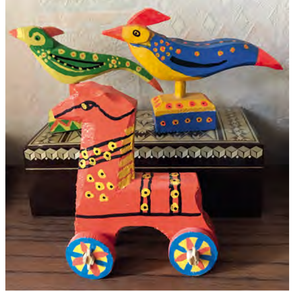
^ Рис. 7. Гороховецкая плотницкая игрушка

реальный сегодняшний адресат. Возможно, что одновременно оно востребуется иными, случайными потребителями, и это сегодняшний потенциальный адресат. Возникшее противоречие между этими реципиентами может привести к смене функциональных приоритетов, что вызовет появление новых реальных и потенциальных адресатов в будущем.