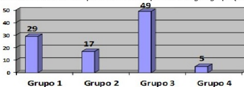
Gráfico 1. Distribución porcentual de los pacientes según grupo (real).

La estratificación de los pacientes de la serie mostró que la mayoría pertenecía al grupo 3 (17 casos, 49 %), que son los que ingresaron por mal control metabólico, o por estado de hiperglucemia aguda no complicada. (Gráfico 1).