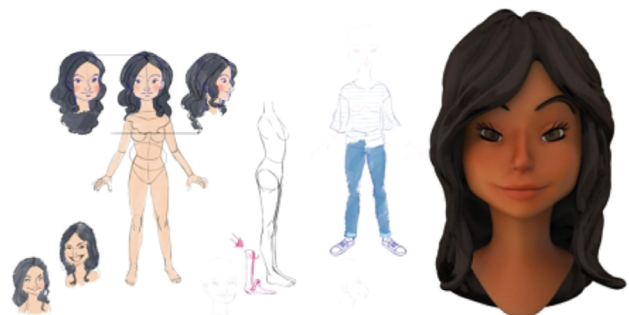
Figura 2. Etapas de criação da personagem Luísa, versão modelagem e versão renderizada.