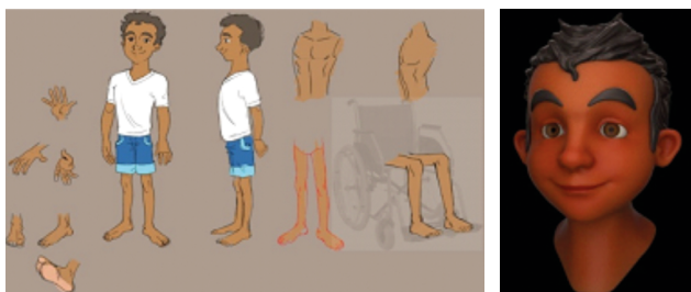
Figura 1. Etapas de criação do personagem Francisco, versão modelagem e versão renderizada.

Os dezoito juízes que participaram do processo de validação de conteúdo do roteiro procediam de diferentes centros brasileiros de referência em reabilitação vesical, além de universidades com estudos voltados para este tema e/ou produção de hiperfímias e tecnologias educacionais. Entre os estados de procedência estavam: São Paulo, Santa Catarina, Rio de Janeiro, Minas Gerais, Bahia, Ceará, Maranhão, Mato Grosso do Sul e Distrito Federal.