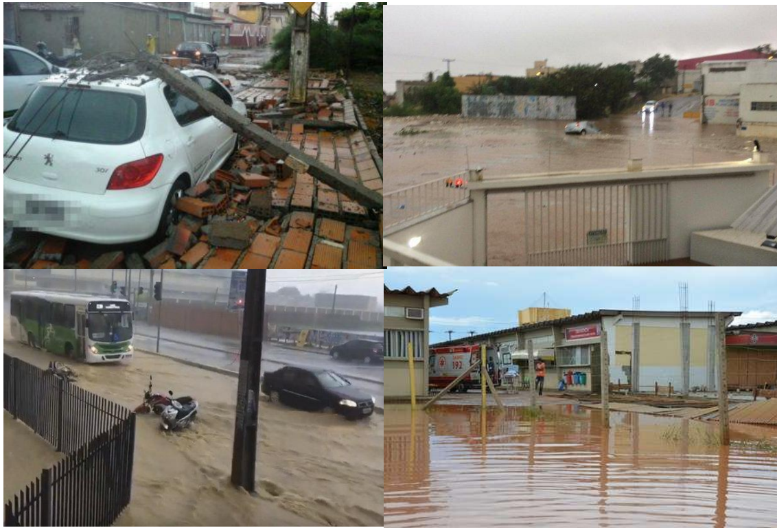
Painel 1- Ocorrências causadas pelas chuvas em Vitória da Conquista.