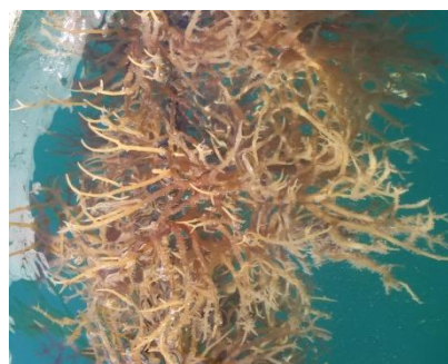
Gambar 1. Alga laut Eucheuma cottonii Kabupaten Bantaeng, Makassar.

tenuicorne ) di laut baltik adalah berkisar 0,70 - 4,51 \mu\text{g kg}^{-1} berat kering.