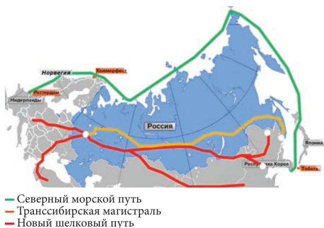
Рис. 1. Карта маршрутов СМП – НШП по территории Российской Федерации

Реализация логистических решений для Нового шелкового пути и Северного морского пути, направленных на усовершенствование и оптимизацию функционирования транспортной системы с использованием цифровых технологий, является одним из приоритетных направлений экономического развития России до 2025 года 2 .