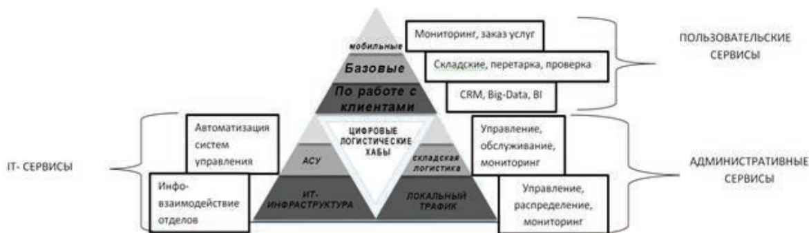
Рис. 2. Локальная архитектура цифрового хаба

Увеличение интенсивности и массы товаротранспортного оборота внутри российского логистического блока, а также обеспечение подконтрольной РФ связи транспортных магистралей Азии и Европы являются приоритетными задачами России, которые могут быть решены развитием и оптимизацией логистической системы СМП – НШП.