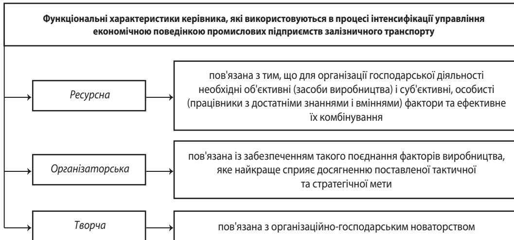
Рис. 2. Функціональні характеристики керівника, які використовуються в процесі інтенсифікації управління економічною поведінкою промислових підприємств залізничного транспорту

Значення цих функціональних характеристик керівника, які використовуються в процесі інтенсифікації управління економічною поведінкою промислових підприємств залізничного транспорту, дуже велике саме сьогодні, коли розвивається нецінова конкуренція, швидко зростає ринок науково-технічних розробок, впроваджуються інноваційна техніка і технології, вдосконалюється інформаційна система тощо.