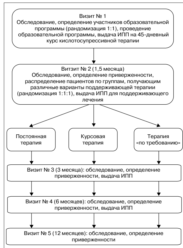
Рис. 1. Дизайн исследования

Пациенты, находившиеся на различных схемах противорецидивного лечения, отличались по