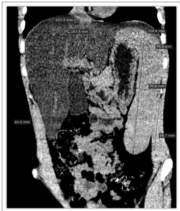
Рис. 1. КТ органов брюшной полости, нативная фаза. Гепатомегалия (20×16 см), спленомегалия (20×4 см). Печень выглядит намного «темнее» селезенки из-за диффузного снижения рентгенологической плотности печени до 23–26 HU. В норме плотность паренхимы печени составляет 50–60 HU, что приблизительно соответствует плотности паренхимы селезенки (40–50 HU), поэтому в нормальных условиях «яркость» печени и селезенки примерно одинаковая.

Fig. 1. Abdominal CT, native phase. Hepatomegaly (liver size: 20×16 cm), splenomegaly (spleen size: 20×4 cm). The liver looks much darker as compared to the spleen because of diffuse decrease of X-ray density of the liver to 23–26 HU. Normal density of hepatic parenchyma is 50–60 HU that approximately corresponds to that of the spleen (40–50 HU) i.e. in normal conditions liver and spleen «brightness» is approximately identical.