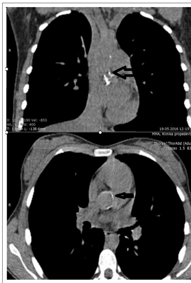
Рис. 2. КТ органов грудной клетки. Кальцифицированные атеросклеротические бляшки в восходящем отделе и дуге аорты (указаны стрелкой).

Случайной впечатляющей находкой при КТ стало снижение рентгенологической плотности паренхимы печени до 23–26 HU. Как известно, в норме плотность паренхимы печени составляет 50–60 HU, что примерно совпадает с плотностью селезенки и крови в сосудах, поэтому у здорового человека сосуды печени в нативной фазе, как правило, не видны. Основные причины диффузного снижения плотности печени – жировая инфильтрация и доброкачественные инфильтративные заболевания, такие как амилоидоз, при котором рентгенологическая плотность печени обычно составляет не менее