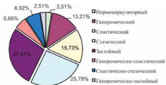
Рис. 4. Частота (%) регистрации различных типов микроциркуляции в поверхностных сосудах кожи предплечий.