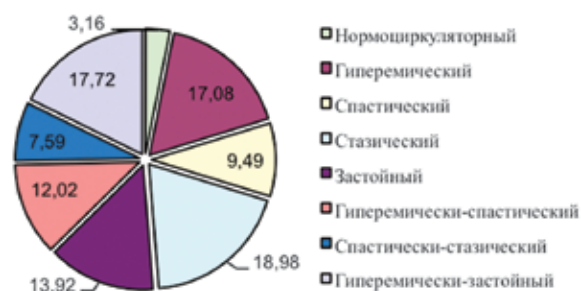
Рис. 2. Частота (%) регистрации различных типов микроциркуляции в поверхностных сосудах кожи кистей.