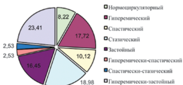
Рис. 1. Частота (%) регистрации различных типов микроциркуляции в глубоких сосудах кожи кистей.