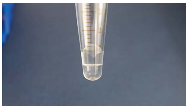
Рис. 2. Экспозиция полимера в заданном объеме жидкости.

Fig. 1. A hydrophilic polymer implant used for modeling aseptic wounds.