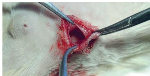
Рис. 7. Сформированная соединительнотканная капсула вокруг импланта при создании модели раны. Fig. 7. A connective tissue capsule formed around the implant when creating a wound model.

У всех животных изучали объем сформированной полости, площадь раневой поверхности, микрофлору ран, морфологические изменения в ране на 7-е сутки. При гистологическом исследовании модели асептической раны было отмечено, что стенка капсулы представлена грануляционной тканью, содержащей большое количество тонкостенных полнокровных сосудов. Клеточный инфильтрат образован преимущественно нейтрофильными гранулоцитами с небольшой примесью лимфо-макрофагального клеточного инфильтрата, фибробластов. Отмечали также инфильтрацию окружающих тканей фибрином. Толщина стенки сформированной полости составила 0,8 \pm 0,1 мм.