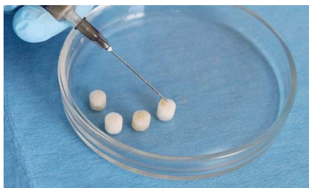
Рис. 5. Введение в имплант бактериальной суспензии, содержащей 0,4 мл монокультуры Pseudomonas aeruginosa в 10^9 КОЕ/мл.

Fig. 4. A polymeric porous implant used to simulate purulent wounds.