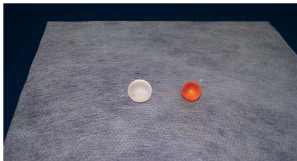
Рис. 1. Гидрофильный полимерный имплант для моделирования асептической раны.

Второй группе создавали модель гнойной раны. Для этого им вводили полимерный пористый имплант аналогичного объема с бактери-