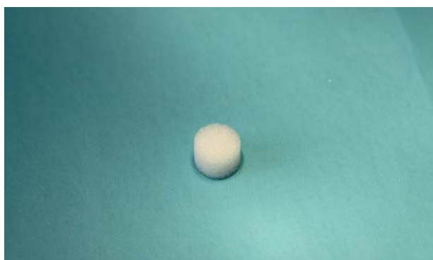
Рис. 4. Полимерный пористый имплант для моделирования гнойной раны.

Fig. 3. Dependence of the volume of a hydrophilic implant on the exposure in an antiseptic solution (in% of the initial volume).