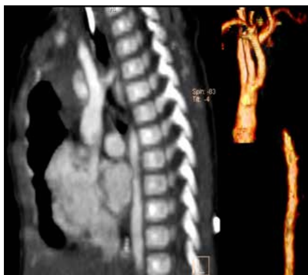
Рис. 1. Пример МСКТ-исследования у новорожденного ребенка. Сагитальный срез и 3D – реконструкция дуги аорты: перерыв дуги аорты, тип А. Метод МСКТ позволяет визуализировать на одном снимке всю анатомию аорты

Диагноз коарктации аорты подтвержден у 16 детей, коарктации с гипоплазией дуги аорты – у 5, перерыв дуги аорты - у 3 (рис. 1), двойная дуга аорты - у 1 пациента.