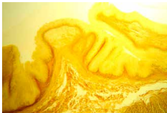
Рис. 1. Плоскоклеточный рак абдоминального отдела пищевода II стадии. Продольная гистотопограмма. Окраска по Ван-Гизону. Фото через МБС-10. Ок. 8. Об. 2

Подслизистая основа на протяжении опухоли выражена неравномерно. В передлах образующихся складок она резко утолщена и составляет основу таких складок. Мышечная оболочка пищевода на всём протяжении опухоли не изменена.