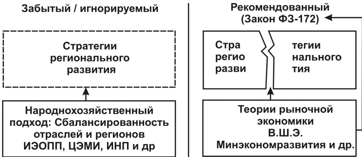
Рис. 1 / Fig. 1. Два подхода к разработке стратегий регионального развития и их теоретические основы / Two approaches to the development of regional development strategies and their theoretical foundations