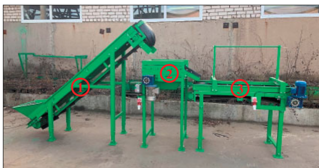
Рис. 1. Экспериментальная линия для послеуборочной обработки корнеплодов и картофеля без средств автоматизации: 1 – загрузочный транспортер; 2 – отделитель примесей; 3 – переборочный стол

Принцип работы схемы заключается в следующем. Блок питания через кабель Type-C подает питание на микроконтроллер и микрокомпьютер. Последний через кабель USB активирует веб-камеру, которая обна-