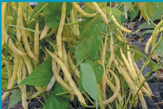
Сорт Солнышко - бобы

Относительная стабильность генотипа (Sgi) выступает важным параметром при селекции культур на адаптивность [17]. Она является составляющей характеристикой селекционно ценных генотипов, сочетающих высокую потенциальную продуктивность и экологическую устойчивость.