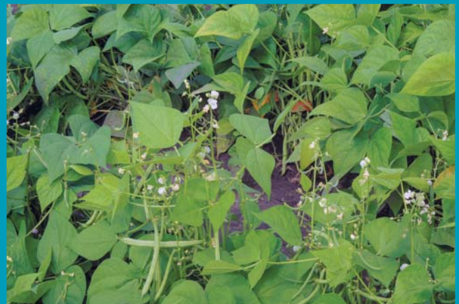
Сорт Дарина - цветение