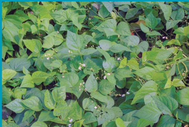
Сорт Ника - цветение