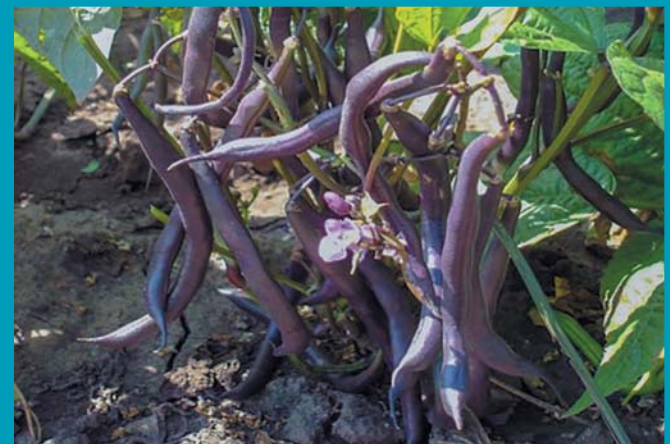
Сорт Виола - бобы