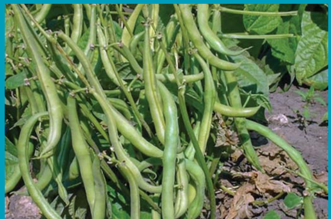
Сорт Дарина - бобы