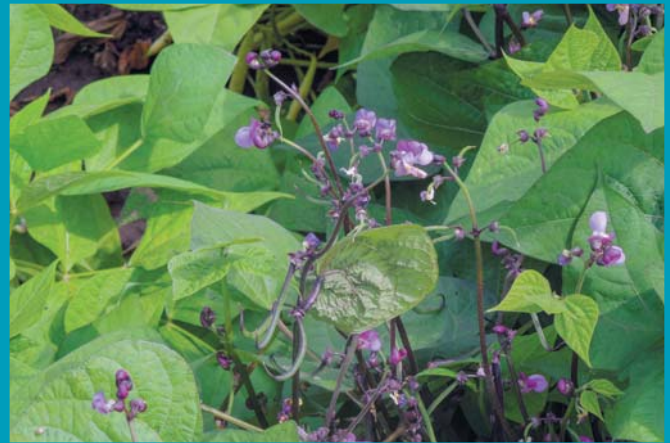
Сорт Виола - цветение

По данным О.С. Корзун и А.С. Бруйло, «...в зависимости от значения коэффициента регрессии сорта сельскохозяйственных растений делятся на два типа: сорта нейтрального типа, со значением коэффициента регрессии значительно ниже единицы, и сорта интенсивного типа с высокой экологической пластичностью – значение коэффициента выше единицы...» [16]. Коэффициент регрессии, равный или больше единицы, говорит о высокой отзывчивости и пластичности образца, при значении меньше нуля или приближенное к нулю – позволяет сделать вывод о низкой адаптивности сорта к изменениям окружающей среды.