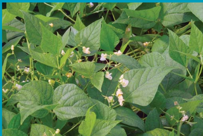
Сорт Солнышко - цветение