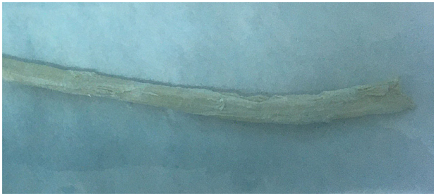
Рис. 2. Говяжье сухожилие после обработки Fig. 2. Bovine tendon after processing

После обработки сухожилие имело следующий вид (рис. 2).