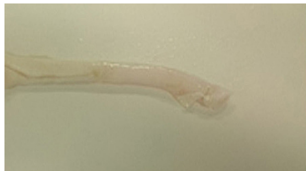
Рис. 1. Говяжье сухожилие разгибателя пальца до обработки

Говяжье сухожилие является доступным сырьем для производства медицинских имплантируемых изделий. Для изготовления протеза связки специально были отобраны сухожилия сгибателя и разгибателя пальца крупного рогатого скота, прошедшего ветеринарный контроль перед забоем, как наиболее подходящие по типоразмерам для решения поставленных клиницистами задач (рис. 1).