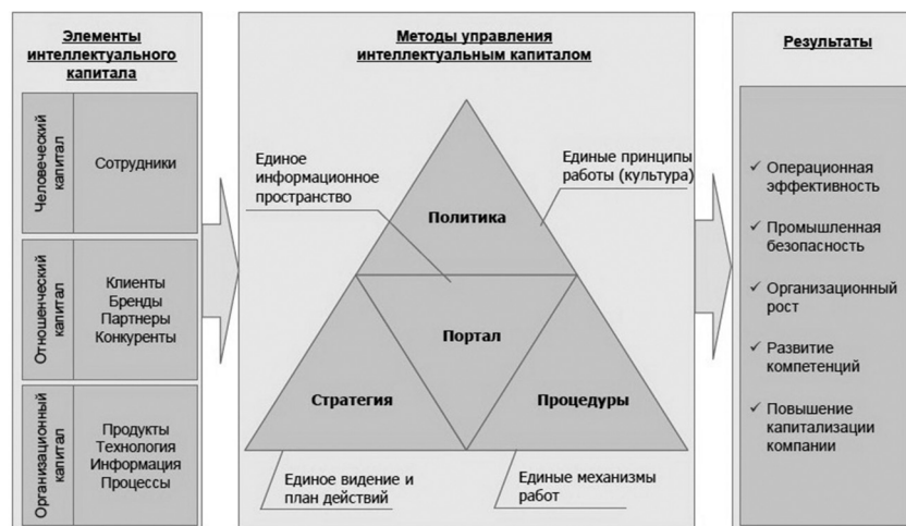
Рис. 2. Информационная система управления «Система поддержки интеллектуального капитала» в ПАО «ЛУКОЙЛ»

Таким образом, внедрение практик управления знаниями позволило создать единое информационное пространство работников блока «Переработка». В течение пяти лет активного внедрения практик управления знаниями в компании «ЛУКОЙЛ», суммарный внутренний рейтинг участников вырос в 4,3 раза, количество разработанных «Лучших практик» выросло в 1,8 раза,