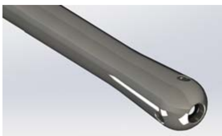
Рис. 2. Сферический наконечник трубчатого концентратора-волновода

В сферическом наконечнике имеются осевое ( (0,50 \pm 0,05) мм) и боковые ( (0,30 \pm 0,05) мм) микроотверстия, предназначенные для воздействия образующейся кавитационной струей как на внутрисосудистое образование, так и на пораженный участок сосудистой стенки, что позволяет восстанавливать проходимость сосуда с одновременным повышением эластичности сосудистой стенки (рис. 2) [5]. Трубчатые концентраторы-волноводы медицинского назначения могут быть изготовлены из коррозионно-стойкой стали (типа 12X18Н10, или могут быть использованы ее аналоги).