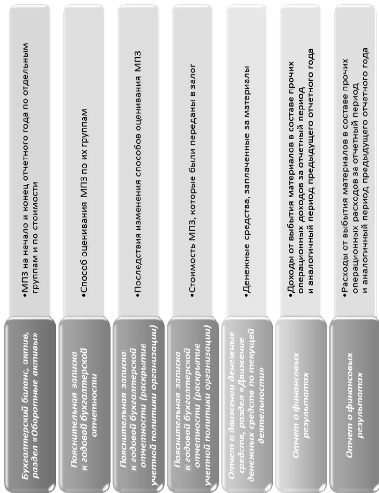
Рис. 4. Информация о раскрытии понятия материально-производственных запасов в бухгалтерской отчетности