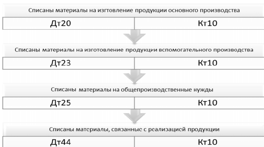
Рис. 3. Корреспонденция счетов по счету 10

ется расходом по обычным видам деятельности. Излишки материально-производственных запасов, которые были оприходованы этим же месяцем, когда проводилась инвентаризация, но переданные в производство в следующем, в бухгалтерском учете должны быть списаны на себестоимость изготовленной продукции, в налоговом учете должны входить в структуру налога на прибыль. Обычно выручка от реализации излишков в бухгалтерском учете включается в прочие доходы. В это же время меняется состав прочих доходов за счет отражения в них стоимости выбывших материалов. Реализованные излишки материально-производственных запасов облагают. В бухгалтерском учете делают следующую корреспонденцию: Д-т 62, К-т 91-1 — проданы излишки МПЗ; Д-т 91-2, К-т 68 (субсчет «НДС») — начислен НДС; Д-т 91-2, К-т 10 — списана стоимость реализованных излишков.