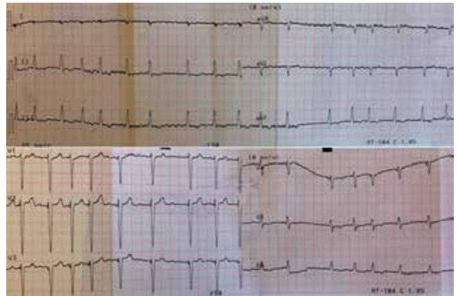
Рис. 1. Электрокардиограмма больного А.

При рентгенографии органов грудной клетки сердечная тень значительно увеличена в размерах (поперечный размер 25 см), корни скрыты за тенью сердца. Правый купол диафрагмы расположен на уровне переднего отрезка 7-го ребра, левый четко не дифференцируется. При рентгеноскопии в левой плевраль-