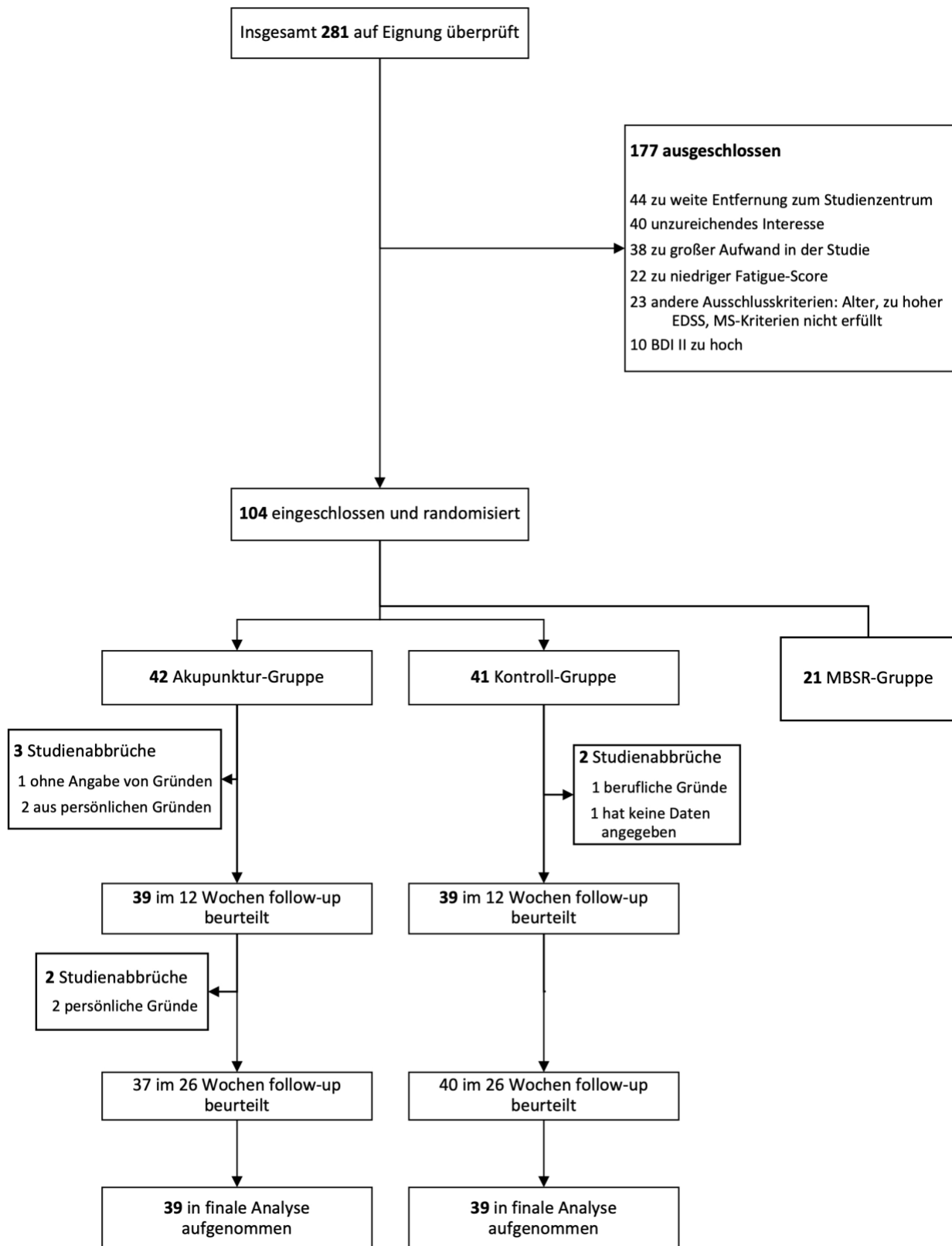
Abbildung 3: Studienverlauf