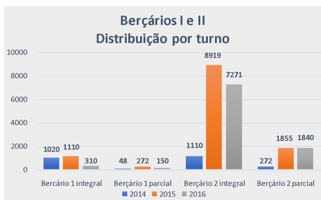
Gráfico 3. Impactos do horário parcial nos Berçários I e II

No entanto, os anos de 2014 e 2015 trouxeram alterações importantes para a creche, em especial a inclusão inédita do horário parcial, além da brusca redução do atendimento. O Gráfico 3 apresenta os Berçários I e II a partir da nova proposta.