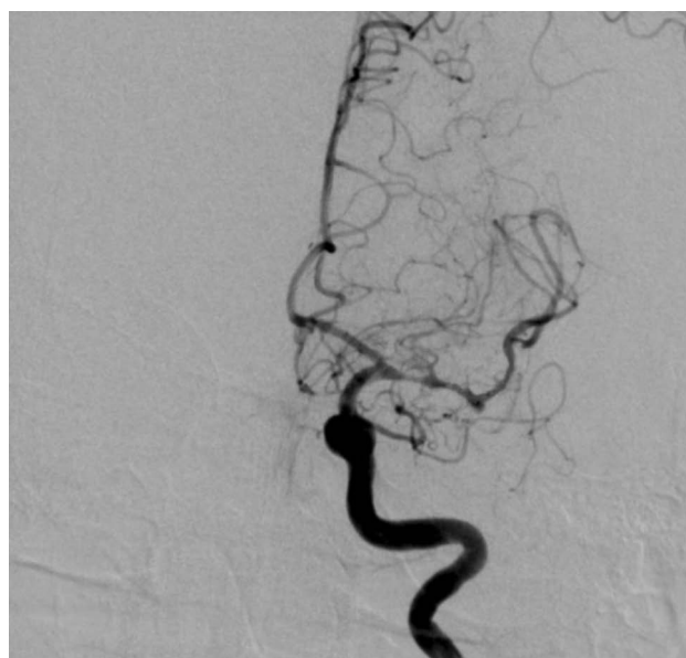
Рис. 4. Восстановление кровотока после тромбэкстракции

Через микрокатетер в область окклюзии введен и раскрыт стент-ретривер Solitaire (Ev3). Произведена двукратная тромбэкстракция из левой СМА стентом-ретривером с восстановлением кровотока до ТICI 2В (рис. 4). Признаков диссекции, тромбоза, дистальной тромбоэмболии не выявлено. Бедренный доступ ушит при помощи Angio-Seal, на правый лучевой доступ наложена гемостатическая шина. Продолжительность эндоваскулярного вмешательства составила 60 мин.