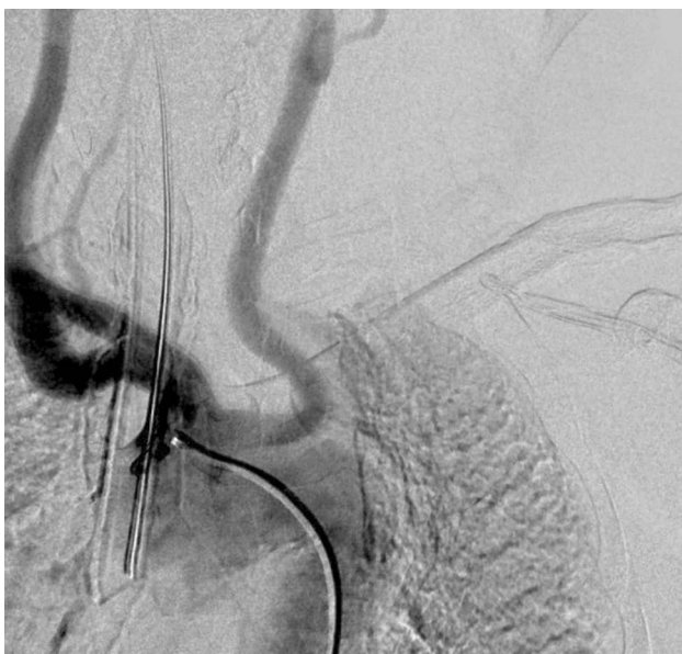
Рис. 1. Ангиография брахиоцефального ствола: отхождение брахиоцефального ствола и левой общей сонной артерии одним устьем от дуги аорты