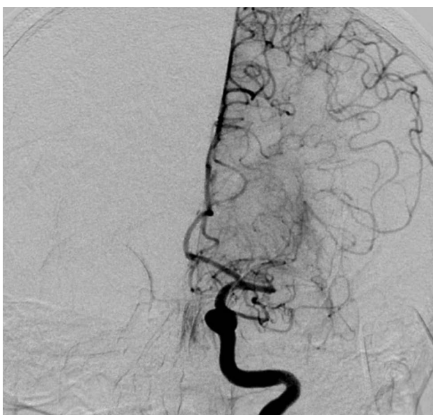
Рис. 2. Окклюзия сегмента М2 левой СМА: состояние до операции