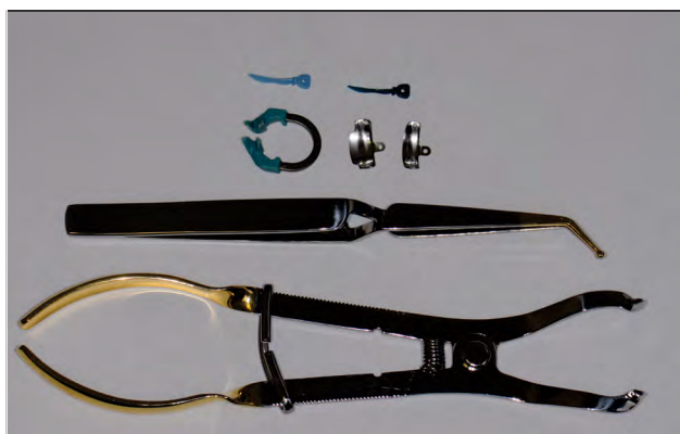
FIGURA 1. Sistem de matrici Palodent® V3, Dentsply

În articolul de față sunt propuse două tehnici directe de restaurare pentru cavitățile de clasa a II-a, tehnica “bulk-fill” și tehnica de refacere a peretului proximal. Pentru ambele tehnici de restaurare s-a folosit sistemul de matrici segmentare Palodent® V3 (Dentsply Sirona, Konstanz, Germania). Acest sistem de matrici este compus din matrici, pene, inel universal, clește pentru aplicarea inelului și pensă cu pinten (fig. 1).