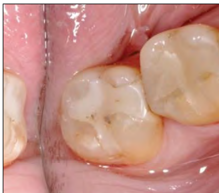
FIGURA 5. Leziune carioasă secundară medie mezio-ocluzal la dintele 4.7

Tratamentul cariei secundare medii mezio-ocluzale a dintelui 4.7 (fig. 5) a urmat aceleași etape ca și cele descrise anterior, cu excepția sistemului de