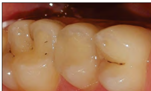
FIGURA 4. Aspect final al restaurării la dintele 1.5

A urmat gravarea acidă a smalțului marginal cu acid ortofosforic 36% (Blue Etch ® , Cerkamed, Polonia), timp de 30 de secunde, s-a spălat cu apă 20 de secunde, apoi s-a uscat excesul de apă cu un jet de aer slab. Adezivul Futurabond M+ s-a aplicat apoi uniform pe întreaga suprafață a cavitații prin pensulare cu aplicatorul timp de 20 de secunde. Adezivul s-a uscat ușor 5 secunde, cu jet de aer slab, și apoi s-a fotopolimerizat 20 de secunde, cu lampă LED.E (Woodpecker ® , lungime de undă 850 mW/cm 2 – 1.000 mW/cm 2 ).