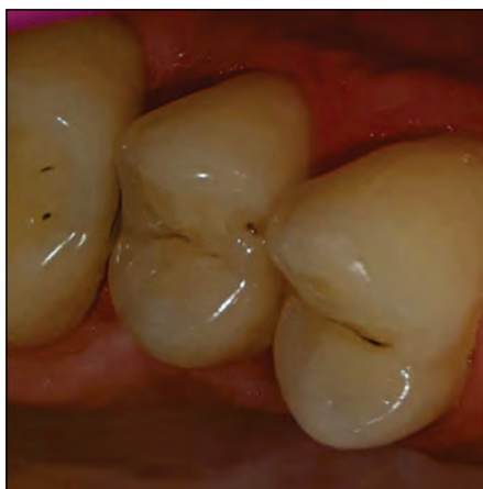
FIGURA 2. Leziune carioasă disto-ocluzală la dintele 1.5