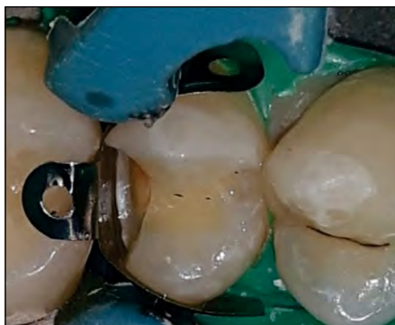
FIGURA 3. Sistemul de matrice Pallodent ® V3 pe dintele 1.5

După izolarea cavitații cu digă (clemă digă Hye-genic Dental Dam Clamp Pak winged – Fiesta, Coltene, Whaledent Inc., Ohio, USA) și toaleta plăgii dentinare (Cavidex ® , Detax, GmbH and Co. KG, Ettlingen, Germania), s-a aplicat sistemul de matrice Pallodent ® V3 (fig. 3).